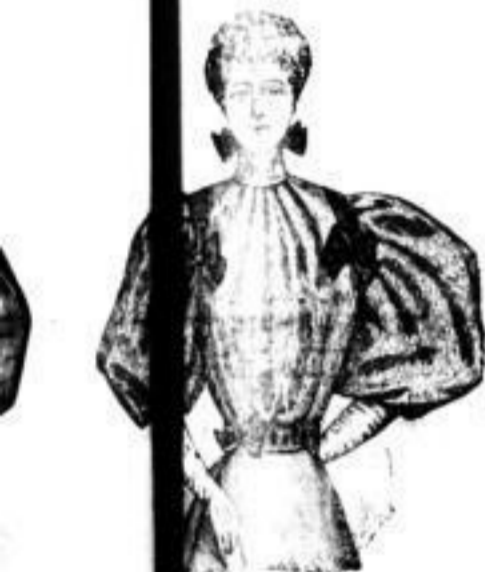
Reine Crêpe-Blousen mit abnehmbaren Schleifen, à M. 8.25.