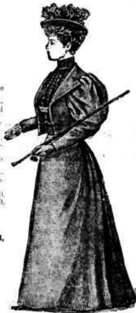
Loden-Costüm, grau u. mode, aus reinwoll. guten Loden, à M. 17.50.

Damen-Oberhemden mit Steh- od. Umleg-Kragen u. Manschetten-Aermeln, einfarbig weiss, blau, rosa oder gemustert in denselben Farben, à M. 3.25, 3.75, 4.50, 5.25, 6.00, 7.50.