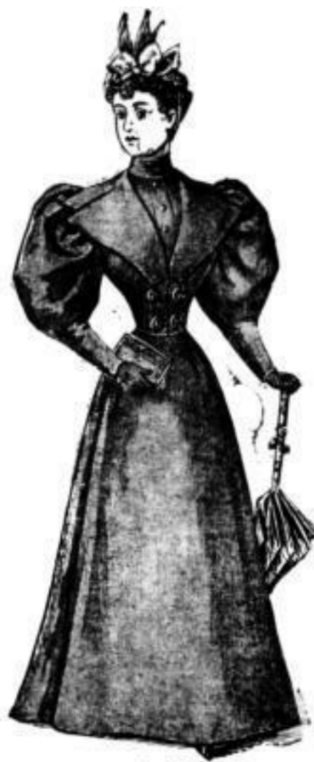
Costüm aus reinw. Foulé, blau u. weiss karriert, mit d'blau Jäckchen, à M. 27.