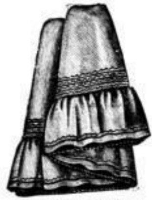
Jupon-Unterrock, mit und ohne Borden-Besatz, à M. 3.50, 4.00, 4.75 - 8.50.