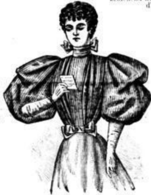
Gemusterte Mousseline-Blousen. aparte neueste Façon, à M. 5.50, 6.00, 7.75.