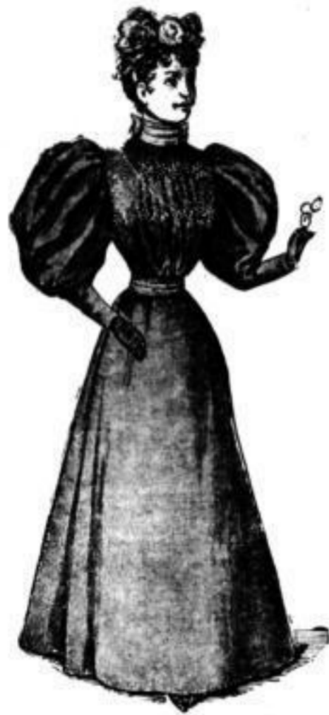
Reinw. Cheviot-Costüm. bestehend aus Rock mit Blousen-Taille d'blau, à M. 21.

Blousen, waschechten Barchent mit Koller, Volant und Bandschleifen, à M. 4.00, Foulé in allen Farben, mit Koller à M. 10.50 Foulé mit Matrosen-Kragen und schwarzem Kragen und Spitze, hochlegant, à M. 11.50