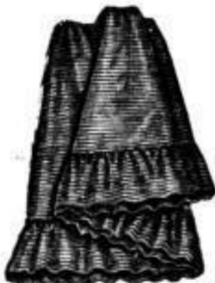
Levantine-Unterrock mit Volant u. Kante, à M. 1.95, 2.70.

in reinwollenem Lodenstoff, grau modfarben, à M. 6.00, 7.25, 9.50, 10.50, in reinwoll. Cheviot d'blau u. schwarz, à M. 9.50, 12.00.