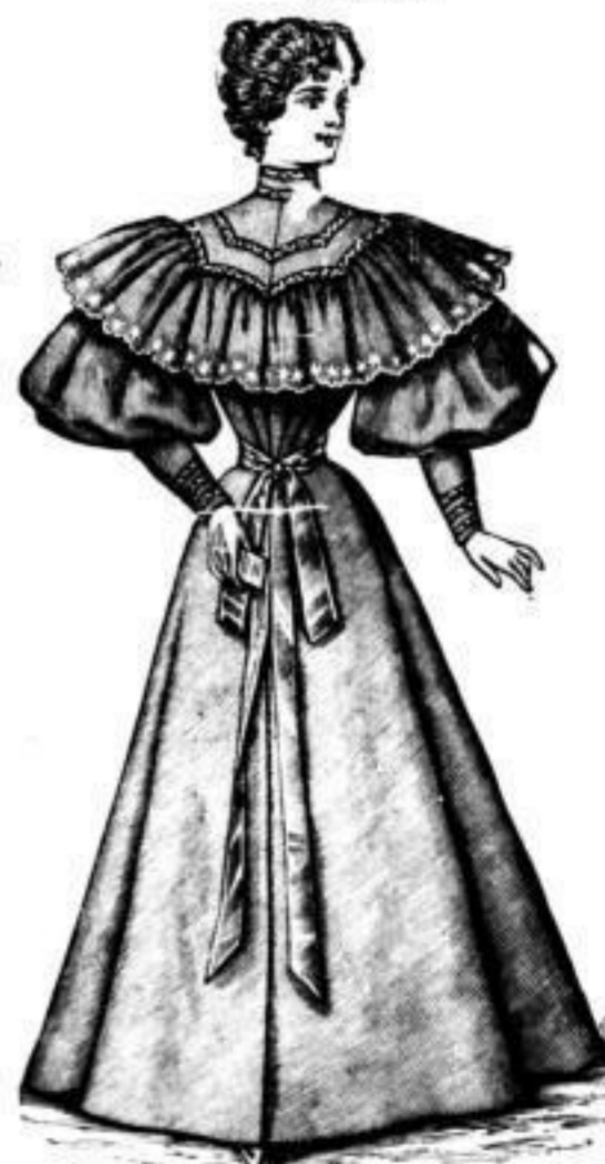
Morgenröckel aus Elsasser Levantine mit reichhaltigem Volant u. Spitzenbesatz à M. 6.75 bis 10.50.

Damen-Vorsteck-Schleifen und Fichus sehr aparte Neuheiten, à 50, 60, 80, 90, 100 bis 150 Pf. Damen-Gürtel aus Leder und Gummi, mit eleganten Schössern à 190, 200, 250 bis 525 Pf.