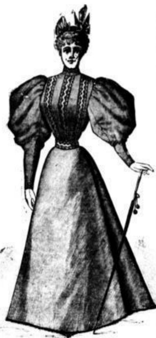
Reinwollenes Cheviot-Costüm in dunkelblau und braun und Blousen-Taille mit ausgeschlagenen Gallons à M. 25.