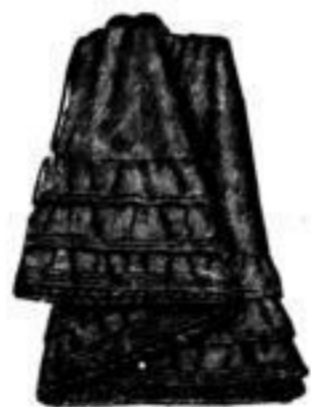
Lustre-Unterrock mit 1 u. 3 Vol. u. Soutache besetzt, à M. 4.00, 5.00, 6.25.