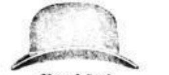
Frankfurt, schwarz oder braun, Mk. 2.—