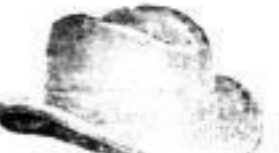
Loschwitz, schwarz oder braun, Mk. 2.—