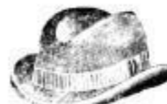
Blasewitz, schwarz oder braun, breiter Rippsband, Mk. 2.—