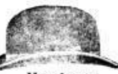
Hamburg, in Schwarz, Mk. 2.—

Feine Hüte aus London, Wien, Paris, sowie ausgesuchte gute deutsche Qualitäten zu allen Preisen.