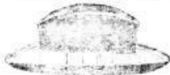
München, in Schwarz oder Braun, Mk. 2.—