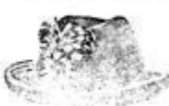
Tinn, Gebirgs- oder Jagdhut, mit Stutz, Mk. 2.—