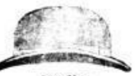
Berlin, in Schwarz, Mk. 2.—