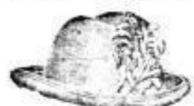
Ritz, Gebirgs- oder Jagdhut, mit Stutz, Mk. 2.—

Das Magazin hat eine Ausstattung erreicht, in der jeder Hut 2 Mark kostet.