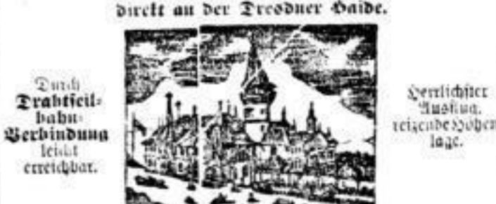
Durch Drahtfeil- bahn- Verbindung leicht erreichbar.

Dresdner Nachrichten. Nr. 32. Seite 23. Sonntag, 2. Februar 1896