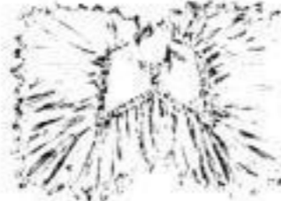
Eleganter Batist-Kragen, crème und weiss, m. ff. Spachtel- Rüsche # 3,75.