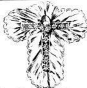
Crème Spachtel-Kragen mit Spitzen-Rüsche # 2,30.