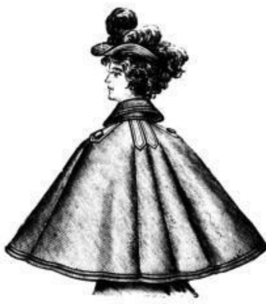
Damen-Caps in marineblau, braun, tabak etc., mit Borde und Schmelz benäht: # 3,50, 4,—, 5,—, 6,50 bis 20,—