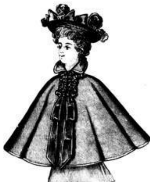
Damen-Cape, aparte Modelarben, verschiedene Façons und Garnierungen. # 3,—, 3,75, 4,50, 6,— bis 15,—