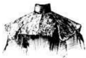
Kragen aus schwarz Seidentüll mit feiner Spachtelverzierung. # 5.