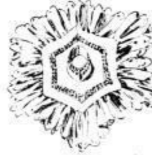
Crème u. weisser Spachtel- Kragen mit ff. Spitzen-Rüsche, # 3,—