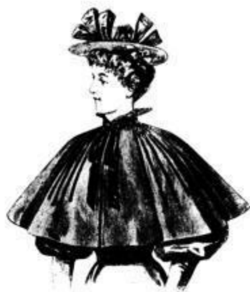
Tuch-Cape, elegante Ausführungen:

schwarz . . . . . # 8,50 do. . . . . # 10,— do. . . . . # 13,— do. . . . . # 18,— etc., etc.