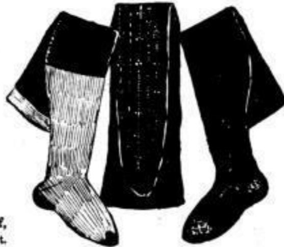
Damenstrumpf, echt schwarz und lederfarbig, baumwollen. 35, 50, 60, 70, 85, 175 #.