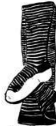
Fein gestreifter baumw. Damenstrumpf, 40 #, 3 Paar 1 #.