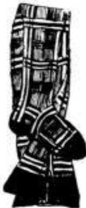
Baumw. Damenstrumpf, schwarz m. ff. seidebestickt, Fussblatt, Qual. B # 1,—, A # 1,25.