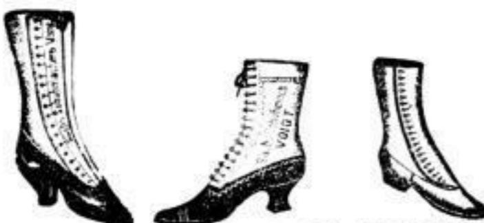
Damen-Knopf- und Schnürstiefel von 6 1/2 BZL bis 24 BZL