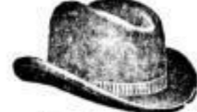
Lochwitz. Schwarz und farbig, Mk. 2.—.