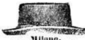
Milano. Italienischer Haarhut, federleicht, Qual. a b c, Mk. 6.—, 7.50, 8.—.

Geleistete Garantie: Jeder Hut, auch der billigste, ist fehlerfrei, sogenannte zurückgesetzte Waare bleibt vom Ladenverkauf ausgeschlossen. Die in den Schaufenstern ausgestellten, mit Preisen versehenen Waaren werden auf Verlangen bereitwillig herorgegeben und verkauft.