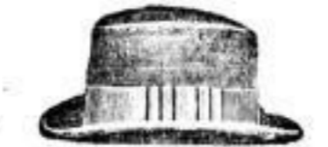
Andrassy. Wiener Hut vom Hofhutmacher Willh. Pless, schw. Mk. 10.—, farb. Mk. 11.—.