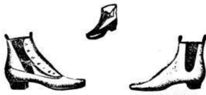
Herren-Zug- und Schnürstiefel von 4 1/2 BZL bis 22 BZL