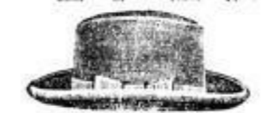
Cöln. Deutsch. Haarhut, schwarz u. farb., Qual. a b c, Mk. 6.—, 6.50, 7.50.