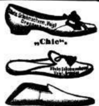
Haus- u. Morgenstühle und Pantoffel von 30 Pfennigen bis 6 Mark