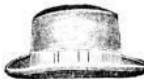
Nelson. Echt engl. Christy, schwarz und braun, Mk. 7.—, 9.50, 10.—.