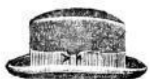
Cromwell. Echt engl. Victor Jay, schwarz und braun, Mk. 12.—.