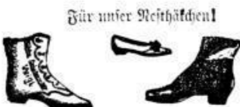
Kinder-Knopf- und Schnürstiefel von 1 BZL bis 8 1/2 BZL