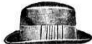
Stuttgart. Deutscher Haarhut, schwarz und farbig, Mk. 7.—.

Bei Bestellungen beliebe man ausser der gewünschten Form die Kopfweite anzugeben.