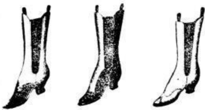
Damen-Zugstiefel von 3 1/2 BZL bis 18 BZL

Dresdner Nachrichten. Nr. 149 Seite 14. Sonntag, 31. Mai 1906