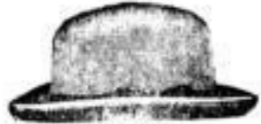
Zittau. Wollfilz, Mk. 2.—, schwarz und farbig.

Geleistete Garantie: Jeder Hut, auch der billigste, ist fehlerfrei, sogenannte zurückgesetzte Waare bleibt vom Ladenverkauf ausgeschlossen. Die in den Schaufenstern ausgestellten, mit Preisen versehenen Waaren werden auf Verlangen bereitwillig herorgegeben und verkauft.