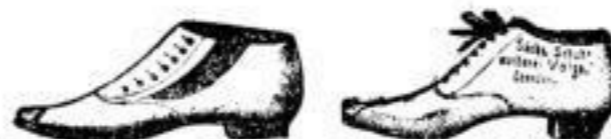
Herren- und Knaben-Halbshuhe von 2 1/2 BZL bis 18 BZL