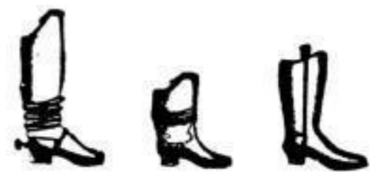
Herren- und Knaben-Schaft- und Reitstiefel von 4 1/2 BZL bis 24 BZL