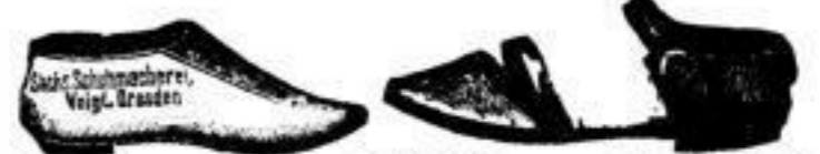
Turn- u. Sport-Schuhe u. Sandalen in Leder, Segeltuch, Kattun etc.