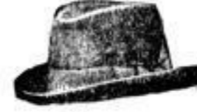
Blasewitz. Schwarz und farbig, mit breitem Rippsband, Mk. 2.—.