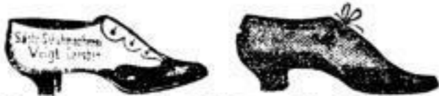
Damen- und Kinder-Halbshuhe von 1 1/2 BZL bis 14 BZL