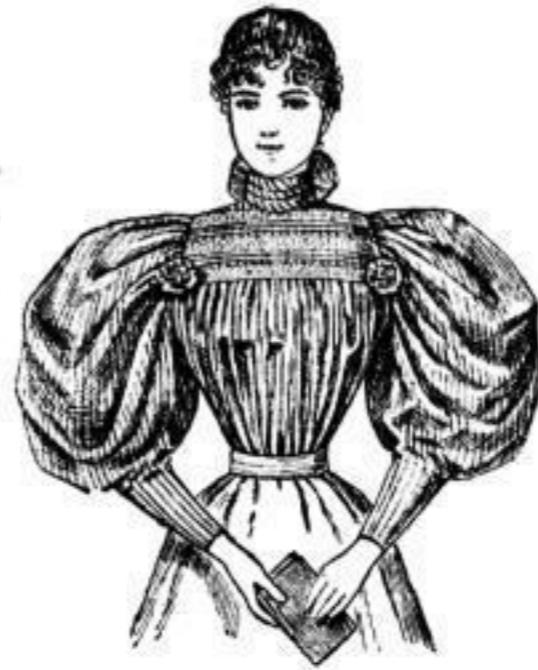
Façon „Irma“, Blouse aus gemustertem Rips, Zephir und Madapolam mit Stekerel-Ein- sätzen, elegante Façon. Stück 6 M. 50 Pf.

aus Elsasser bedruckten Wasch- Stoffen. Stück 1.75, 6.50, 8.50 bis 36 Mark.