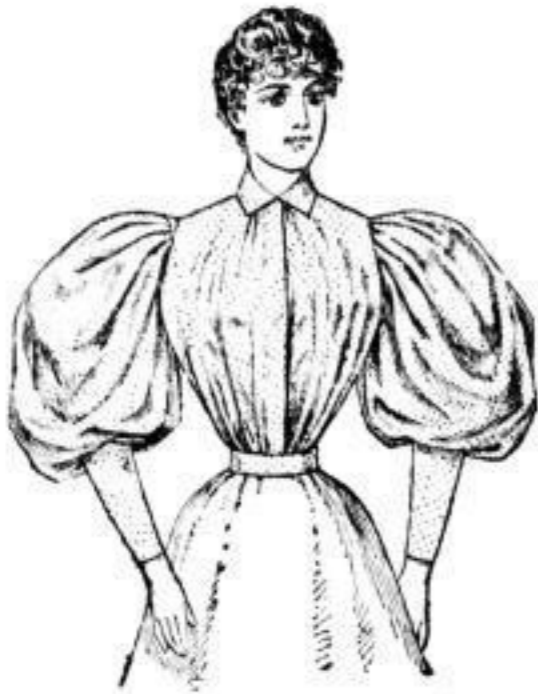
Façon „Hanne“, Blouse aus waschecht bedrucktem Elsasser Levantäne. Stück von 225 Pf.