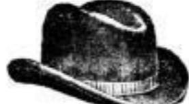
Loschwitz. Schwarz und farbig, Mk. 2.—.