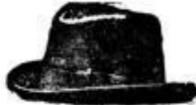
Blasewitz. Schwarz und farbig, mit breitem Ripstand, Mk. 2.—.