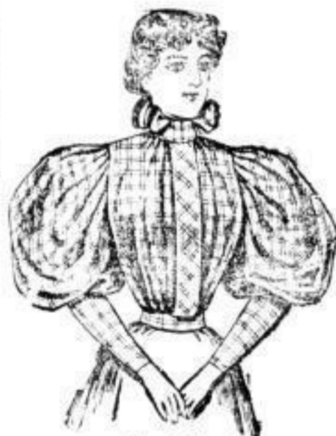
„Lotte“ N. 3,25.

Dresdener Nachrichten. Nr. 279. Seite 24. — Donnerstag, 8. März. 1896