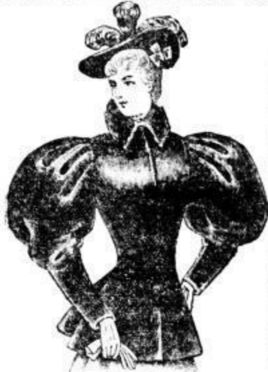
TRIUMPH 65 cm lang SEALSKINJACKET Mk. 350.