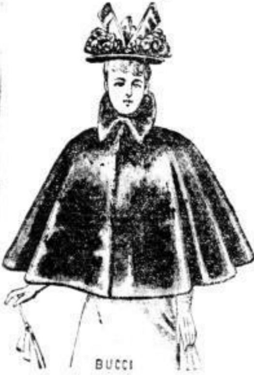
BUCCI Sealskin-Jackets werden aufgefärbt und modernisiert.

Dresdner Nachrichten, Nr. 209, Seite 28. Mittwoch, 28. März, 1890