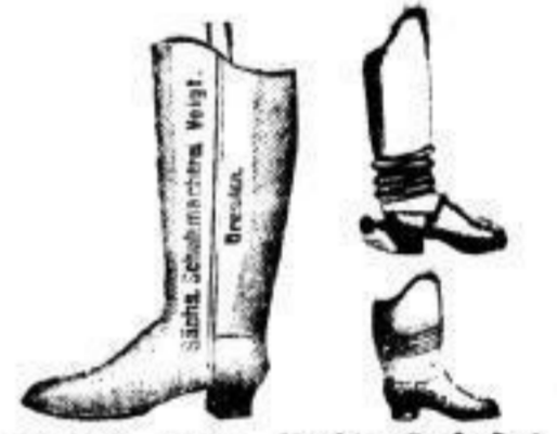
Schaft- und Reit-Stiefel für Herren, Knaben und Damen von 4 1/4 Mk. bis 36 Mk.