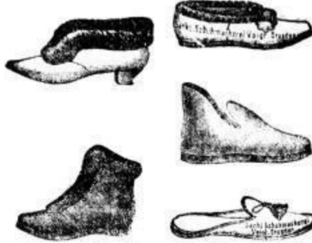
Filz-Schuhe und Pantofel mit Filz- und Ledersohlen für Damen, Herren u. Kinder von 2 1/2 Pf. bis 8 1/2 Mk.