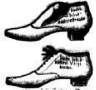
Halbschuhe für Damen, Herren u. Kinder von 75 Pf. bis 16 Mk.