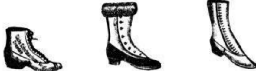
Kinder-Knopf- und Schnürstiefel von 1 1/4 Mk. bis 5 1/2 Mk.