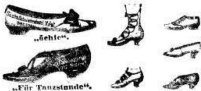
Tanzschuhe und Stiefel für Damen, Herren und Kinder von 2 Mk. bis 12 Mk. Gummi-Heberschuhe von 1/4 bis 3/4 Mk.