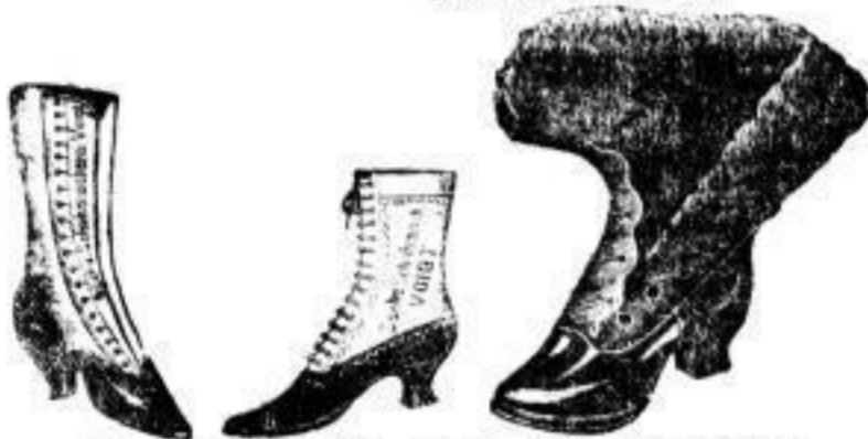
Damen-Knopf- und Schnürstiefel von 5/4 Mk. bis 24 Mk.