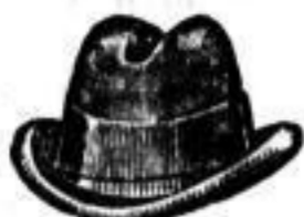
Deutscher Wollhut 2 M., 2 M. 50 Pf., 3 M., 50 Pf., schwarz und in allen Farben, das Beste 4.50.