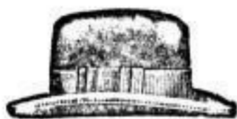
Französischer Haarhut von verschiedenen Fabrikanten, 6 M., 7 M. 50 Pf., 10 M., 50 Pf., Nur in schwarz.

Geldwerte Garantie: Jeder Hut, auch der billigste, ist fehlerfrei, sogennante zurückgesetzte Waare bleibt vom Ladenverkauf ausge- schlossen. Die in den Schaufenstern ausgestellten, mit Preisen versehenen Waaren werden auf Verlangen be- reitwillig heringegeben und verkauft.