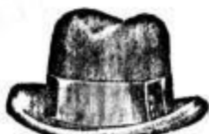
Italienischer Haarhut 6 M., 6 M. 50 Pf., 7 M., schwarz, farbig und grau, Sehr dauerhaft.

Catalog wird gratis und franko zugeschickt.