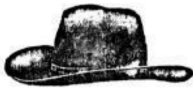
Italienischer Künstlerhut. Borsalino Giuseppe, Alessandria, das beste Fabrikat, schwarz u. grau, 12.— Deutscher Haarhut 6.—, 6.50, 7.— Deutscher Wollhut 2.—, 2.50, 3.— In grau, das Beste, 6.—

Bei Bestellungen beliebe man ausser der gewünschten Form die Kopfwerte anzugeben.