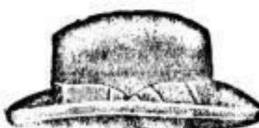
Englischer Haarhut. Christy, London 6.—, 8.—, 12.—, Victor Jay, London 12.—, Lincoln Bennett, London 12.—

„Zum Pfau“, Robert Galdeczka, Frauenstr. 2.