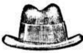
Deutscher Haarhut 6 M., 7 M., 7 M. 50 Pf., in schwarz und farbig, federleicht, 11.—, 10.50.