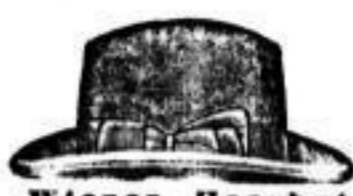
Wiener Haarhut vom Hofhutmacher Pless, in schwarz 11.— Andere Wiener Haarhüte schwarz u. farbig, 7.50, 9.—