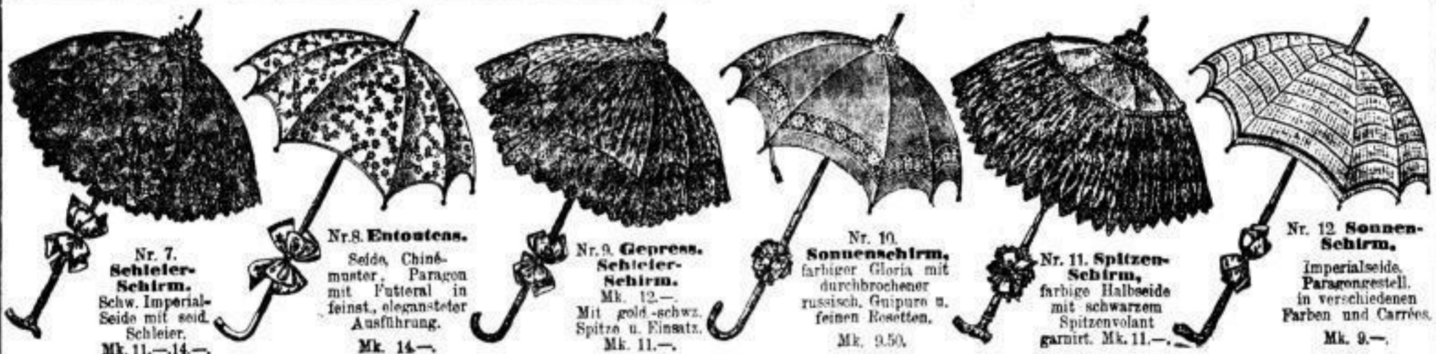
Nr. 7. Schleier-Schirm. Schw. Imperial-Seide mit seid. Schleier. Mk. 11.—, 14.—

Nadel-Sonnenschirme in schwarz u. in glatten Nuancen, mit passendem Futteral u. Schleifen, blau, crème, beige, changeant weiss etc. Mk. 4, 5, 6, 6.50.