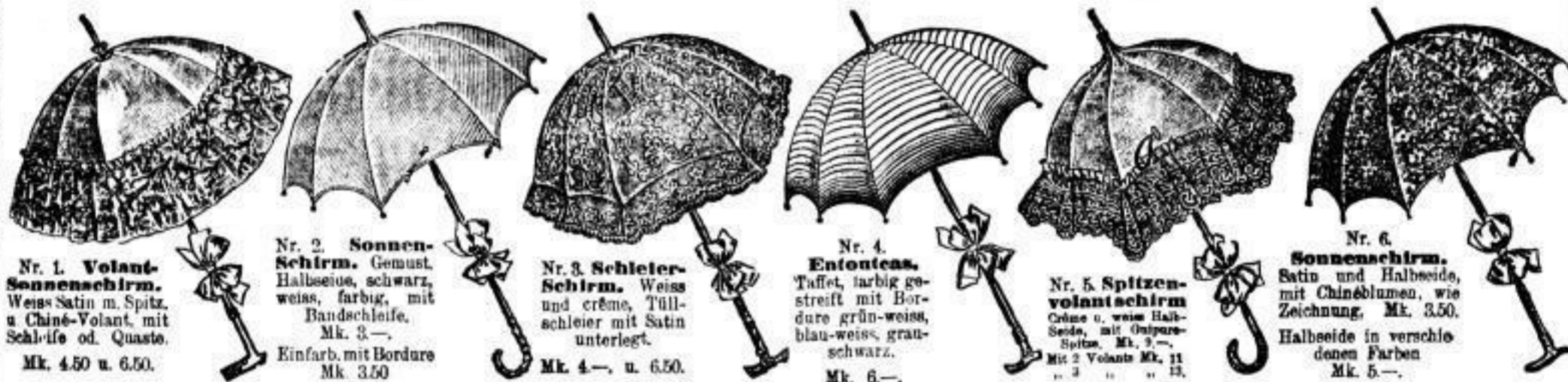
Nr. 1. Volant-Sonnenschirm. Weiss Satin m. Spitz, u. Chiné-Volant mit Schilfe od. Quaste. Mk. 4.50 u. 6.50.