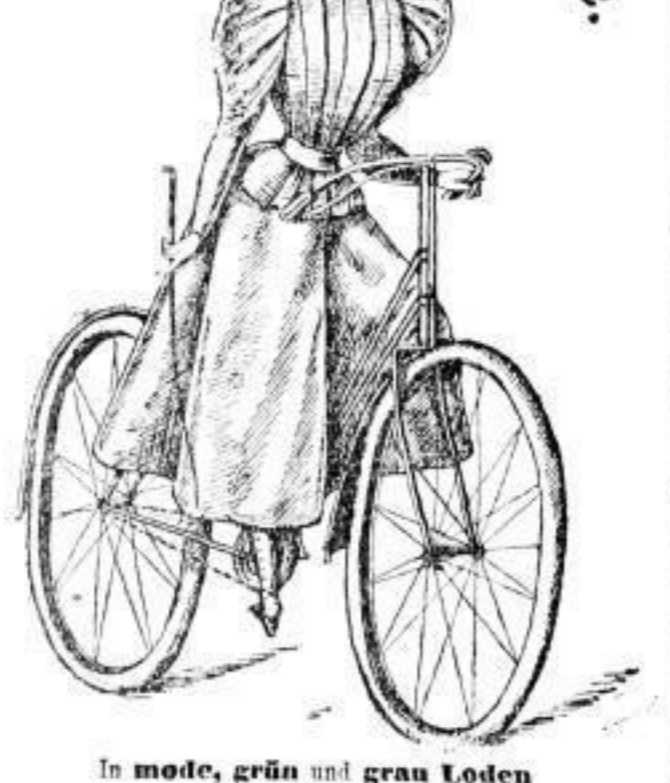
In mode, grün und grau Loden Mk. 26.—