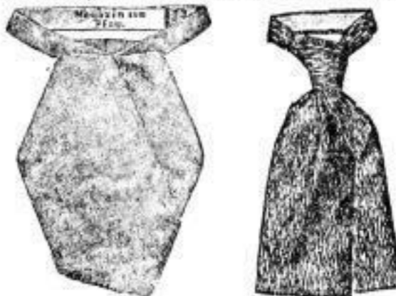
Guido , eleg. Ausführung, hell u. dunkel, 1 Mk. Selpio , hell und dunkel, schöne Schotten, 1 Mk.

Zu billigeren Preisen sind nach Pfingsten eine Partie Cravatten zum Verkauf gestellt worden: Regattes, hell und dunkel, versch. Façons . . . 75 Pf. Für in Hands (Selbstbinder) . . . . . 50 Pf. Wusch-Cravatten, neue Dessins . . . . . 25 Pf. Auch wird auf die grosse Kollektion Cravatten zum Einheitspreise von 1 Mark aufmerksam gemacht.