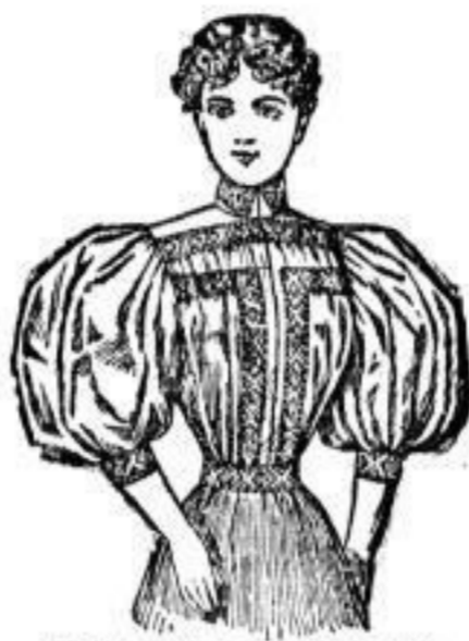
Façon Hedwig 4,00 Mk.