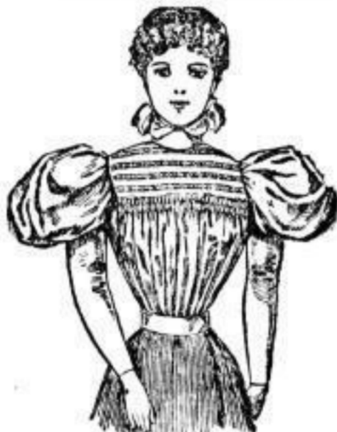
Façon Edith 7,50 Mk.