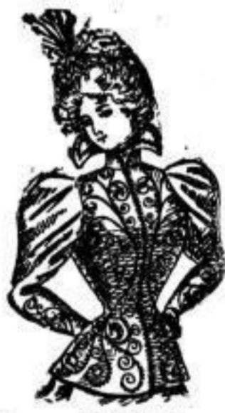
Margaretha. Jackett aus Doublestoff, reich mit Boutache besetzt, Reif mit Seide gefüttert, Farben: Schwarz, grün. J 21. Aethaliches Muster ohne Futter. J 25.