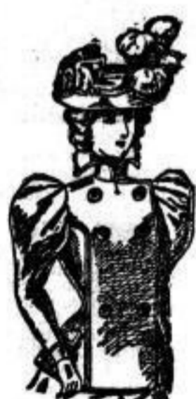
Clara. Jackett aus schwarzem Miracost. J 6.75. J 10. J 8.50 (schwarz und braun).