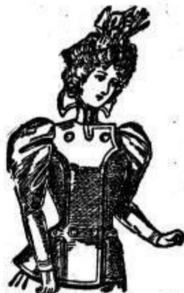
Käthe. Jackett aus rotawoll. Kätze, Farben: Schwarz, braun, mode. J 21.