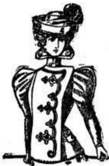
Irma. Jackett aus Doublestoff, mit Boutache-Verzierungen, Farben: Schwarz, dunkelgrün, blau. J 16. Mit reicher Ausstattung. J 21.