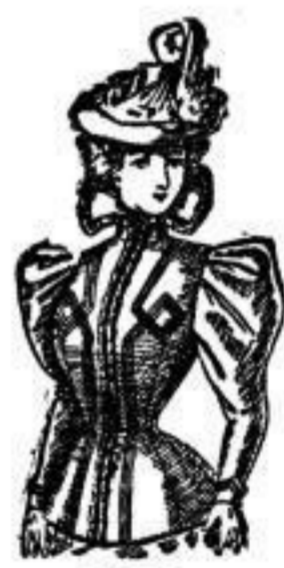
Helene. Jackett aus Doublestoff, mit Boutache verziert und Fels eingestickt, Farben: Schwarz, braun, blau. J 16.50.