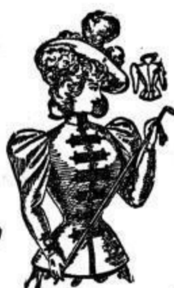
Husar. Jackett aus Doublestoff, mit breiter Tresse verziert, Farben: Schwarz, blau, oliv. J 20.