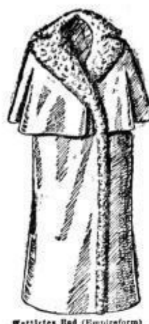
Wattirtes Had (Empireform) mit Moosstoff, mit seidnen Steppfutter. # 35.-- Mit baumwollenem Satin-Steppfutter # 25.--