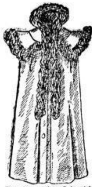
Eleganter, wattirtes Hadmantel (Empireform), reich mit Tischt besetzt, mit seidnen Futter. # 63.-- In feinstem, sammettem Oberstoff # 68.--