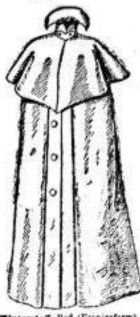
Winterstoff-Had (Empireform) in hellem, weichen Moosstoff. # 47.-- In schwarzem Rafin oder Noppenstoff. # 25.--