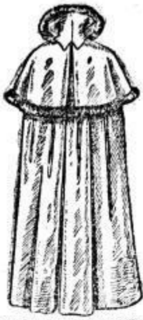
Wattirtes Had (Empireform), Pelz- oder Felle, mit baumwollenem Satin-Steppfutter. # 25.-- Mitreinwoll-Steppfutter. # 30.-- Pelz- oder Felle, mit baumwollenem Satin-Steppfutter. # 13.50.