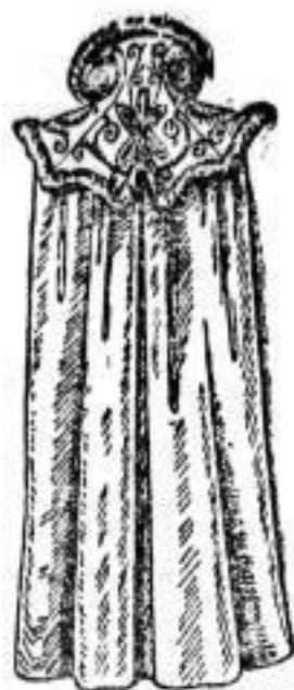
Wattirtes Had mit grosser Pass aus Felle eingewickelt, mit baumwollenem Satin-Steppfutter. # 28.-- Dasselbe Form ohne Steppfutter # 21.-- # 24.--