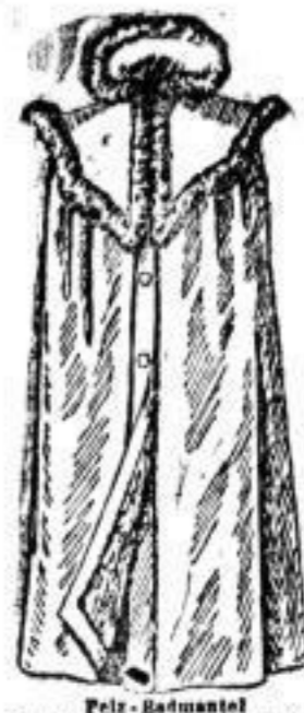
Pelz-Hadmantel im Rücken anschlüssend, Felle mit Opasum eingewickelt, mit schwarzem Castingeweg. Hamsterfutter # 60.-- Fellwollwollfutter # 70.--