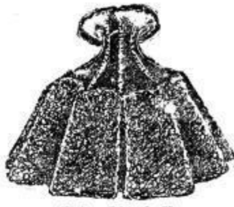
Feder-Plüsch-Kragen mit Sammet-Koller und Perlen- Verzierung. 50 cm lang. # 15.— Derselbe mit Krimmer-Ansatz. # 12.—