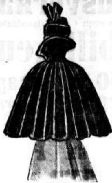
Bucci Blumfeal Tod . . . Mk. 110.— Electrique . . . . . 75.— Persianer . . . . . 230.— Sealstln . . . . . 300.—