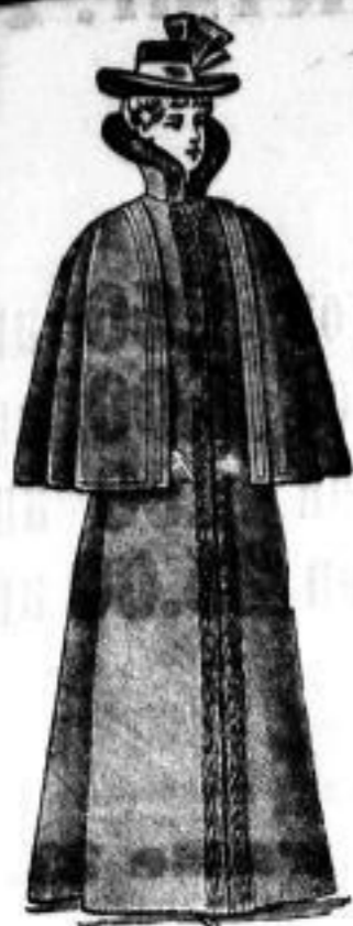
Portia Bezug: Reine Wolle. Futter: Samter. Belag: Schwarz; auße. Dvoffum. Mk. 110.— Schwamme mit Natur-Stunfs Mk. 220.—