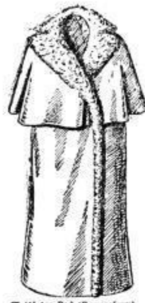
Wattirtes Rad (Empireform) mit Aufhängen, mit seidnem Steppfutter. # 38.— Mit baumwollenem Sate-Stepp- futter. # 28.—