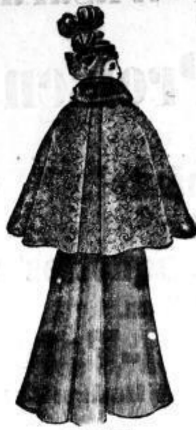
Maritana Länge 16 Cm. Bezug: Hocheleg. franzöf. Wolle. Futter: Fehwamme. Belag: Rot. Stunfs. Mk. 135.—