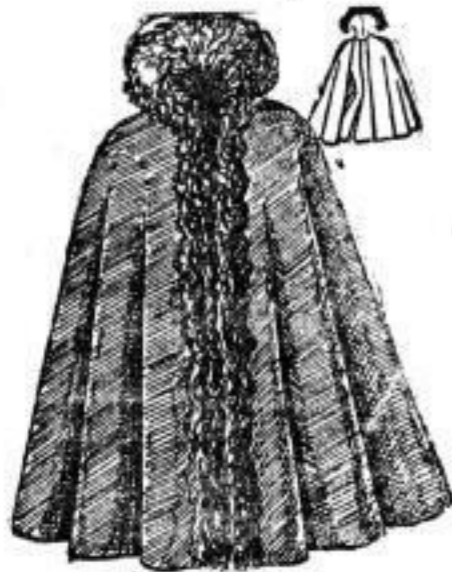
Carola, wattirtes Cape aus schwarzem reinwollenen Coating, innen Seide, vollem Tibet-Kragen und vorn herunter eingerollt. 80 cm lang. # 43.— Dasselbe, Innen mit Cloth-Serge und vollem Lambs-Kragen. 80 cm lang. # 38.—