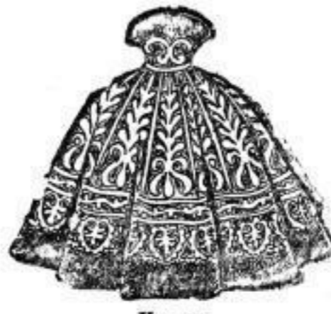
Kragen aus Seiden-Velour — Qualität II — mit appliitem Tuch-Ueberkragen, mit Seide gefüttert. 55 cm lang. # 21.—