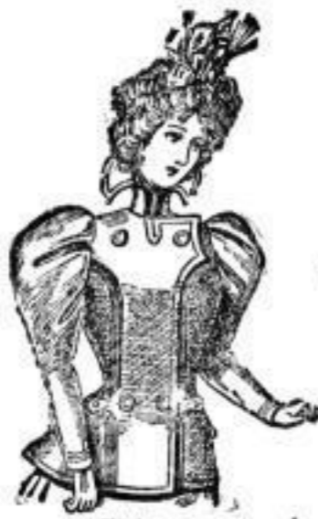
Käthe, Jackett aus reinwoll. Stoffen, Farben: Schwarz, braun, mode. # 21.—