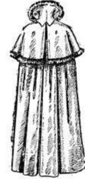
Wattirtes Rad (Empireform), Pe- lerine m. Fell bes., m. baumwoll. Satin-Steppfutter. # 25.— Mitreinwoll. Steppfutter. # 30.— Pelarine kürzer, mit baumwoll. Körper-Steppfutter. # 1350.