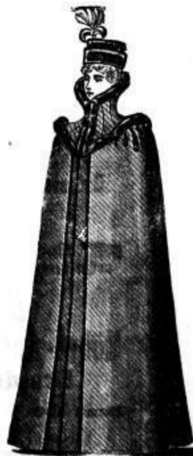
Zürich Bezug: Schwarz Goldwoll. Futter: Samter. Belag: Französ. Canin Mk. 45.— Fehriden mit Sealstln Mk. 125.—