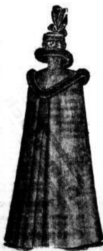
Luzern Bezug: Reine Wolle. Futter: Samter. Belag: Schwarz auße. Dvoffum. Mk. 100.— Schwamme mit naturell Stunfs. Mk. 160.—

Dressner Nachrichten. Nr. 310, Seite 41. — Sonntag, 14. October 1899