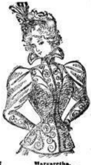
Margaretha, Jackett aus Doublestoff, Reich mit Boutache verziert, Reich mit Seide gefüttert, Farben: Schwarz, grün # 31.— Anzügliches Muster ohne Futter # 23.—