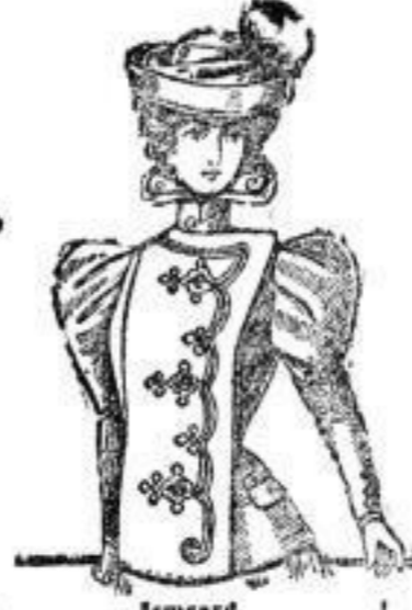
Erzengard, Jackett aus Doublestoff, mit Boutache-Verzierungen, Farben: Schwarz, dunkelgrün, blau. # 14.— Mit reicher Ausstattung. # 21.—