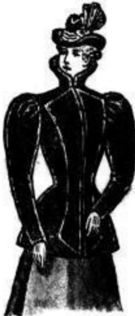
Alexandra Länge 70 Centimeter. Echt Sealstln. Mk. 450.—

Der Katalog enthält 9 Façons für Sealstln-Jaquettes von 360—650 Mk. 5 für Breitfchwanz- und Persianer- Jaquettes.