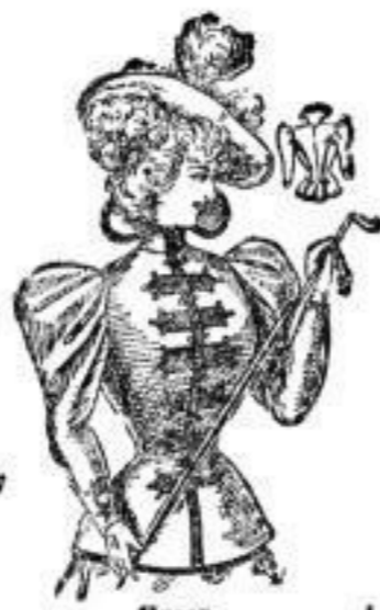
Honor, Jackett aus Doublestoff, mit breiter Tresse verziert, Farben: Schwarz, blau, oliv. # 20.—