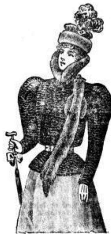
Ural Breitfchwanz mit Zobel, sehr leicht. Mk. 700.— Sealstln mit Chinchilla. Mk. 800.—

Dressner Nachrichten. Nr. 310, Seite 41. — Sonntag, 14. October 1899