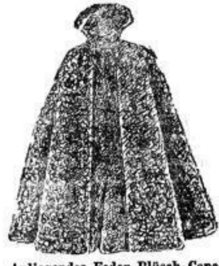
Anliegendes Feder-Plüsch-Cape mit farbigem Seiden-Futter u. 90 cm langen Aermeln. 65 cm lang, Qual. S 2. # 22.— Dasselbe, Qual. S 1, mit schwarzem Seiden- Futter. # 31.— 80 cm lang, Prima-Qual., beste Verarbeitung. # 46.—