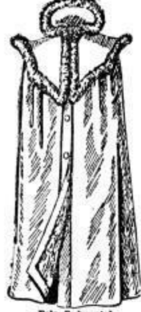
Fell-Radmantel im Rücken angeschlossen, Passé mit Onossum eingewollt, mit schwarzem Coatingbezug. Hamsterfutter # 60.— Fehwannefutter # 70.—