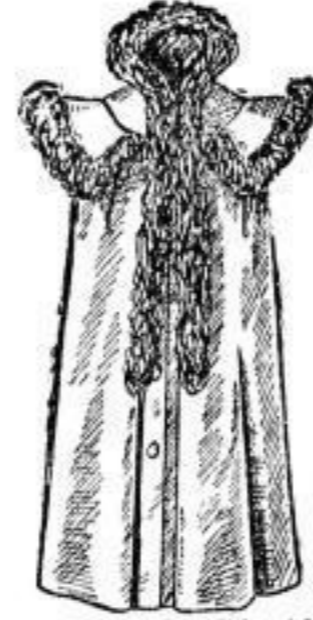
Eleganter, wattirtes Radmantel (Empireform), reich mit Tibet besetzt, mit seidnem Futter. # 63.— In feinstem, rasegrütem Oberstoff # 65.—