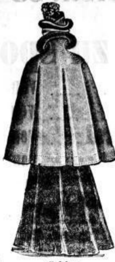
Sabine Länge 96 Cm. Bezug: Damentuch. Futter: Samter. Belag: Schwarz auße. Dvoffum. Mk. 55.—