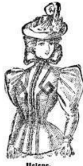
Helene, Jackett aus Doublestoff, mit Boutache verschürrt und Fell eingewollt, Farben: Schwarz, braun, blau. # 1650.