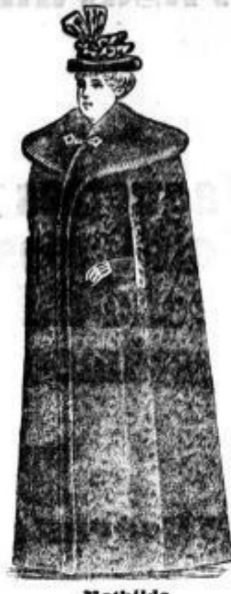
Mathilde Bezug: Fran. St. Wolle, Futter: Fehwamme, Belag: Schwarz; Goldbär! Mk. 105.— Fehriden mit Stunfs. Mk. 610.—

Der Katalog enthält: 25 Façons für Sealstln . . von 110—210 Mk. 8 „ „ „ „ „ „ „ „ 170—300 „ Persianer-Pelerinen . . . . 180—200 „ Biber von 270—400 Mk. Marder . 60 Mk. Netz . 450—800 „ Stunfs . . 180 „