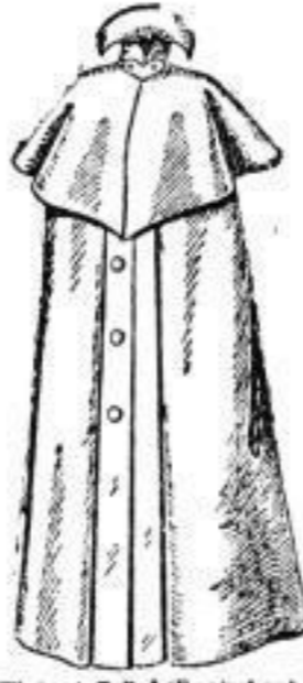
Winterstoff-Rad (Empireform) in hellen, weichen Moussestoff. # 27.— In schwarzem Raffel oder Noppenstoff. # 25.—