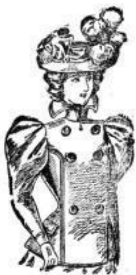
Clara, Jackett aus schwarzem Mirastoff. # 575. # 10.— # 850 (schwarz und braun).