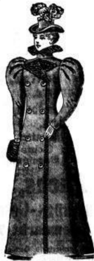
Krimm Bezug: Französische Wolle. Futter: Fehriden. Belag: Sealstln. Mk. 200.—

Der Katalog enthält 9 Façons für Sealstln-Jaquettes von 360—650 Mk. 5 für Breitfchwanz- und Persianer- Jaquettes.