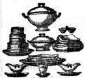
Tafel-Servicees, neue Fassons, weiße Tafelsets, mit reizender Malerei, für 12 Personen, 92 Theile von 42 M. an.