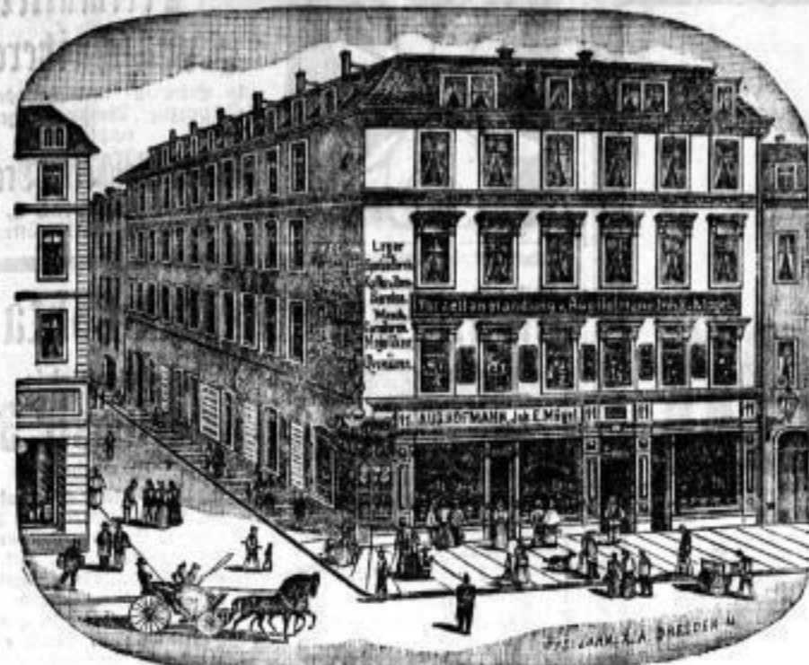
empfehlen in größter Ausdehnung:

Ecke Quergasse Scheffelstr. 11 Ecke Quergasse