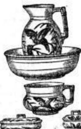
Wash-Garnituren, über 200 Muster, für jedes Zimmer passend, fein bis zu 30 M. an.