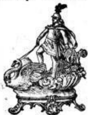
Vasen, Jardinières, Blumentöpfe, Wandplatten etc.