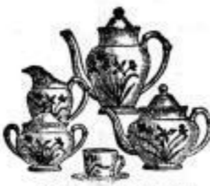
Kaffee-Servicees, größtes Lager, solche Qualität, zu anerkannt billigen Preisen.

Ecke Quergasse Scheffelstr. 11 Ecke Quergasse