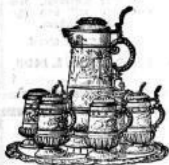
Bier-Servicees, Bowlen, Seidel, Pumpen etc.