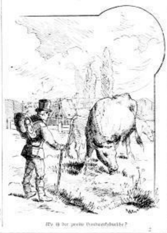
Wie ist der große Perlenhalsband?