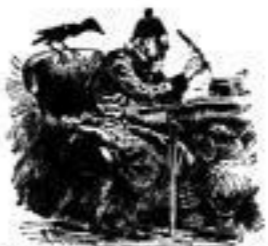
Nele geharnischte Sonetten

„Oh! Er war vor uns ein'...“ „Oh! Er war vor uns ein'...“