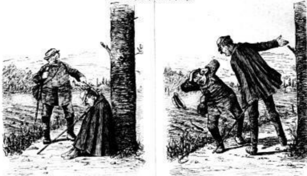
Handwerker (zu einem Mann): „Halt! Du bist ein Schläger, wenn Du Schläger bist.“