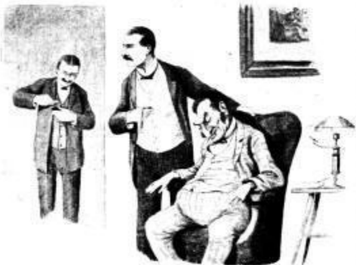
„Jetzt hat ich einen Bankrott...“