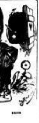
Die hier herrschen...