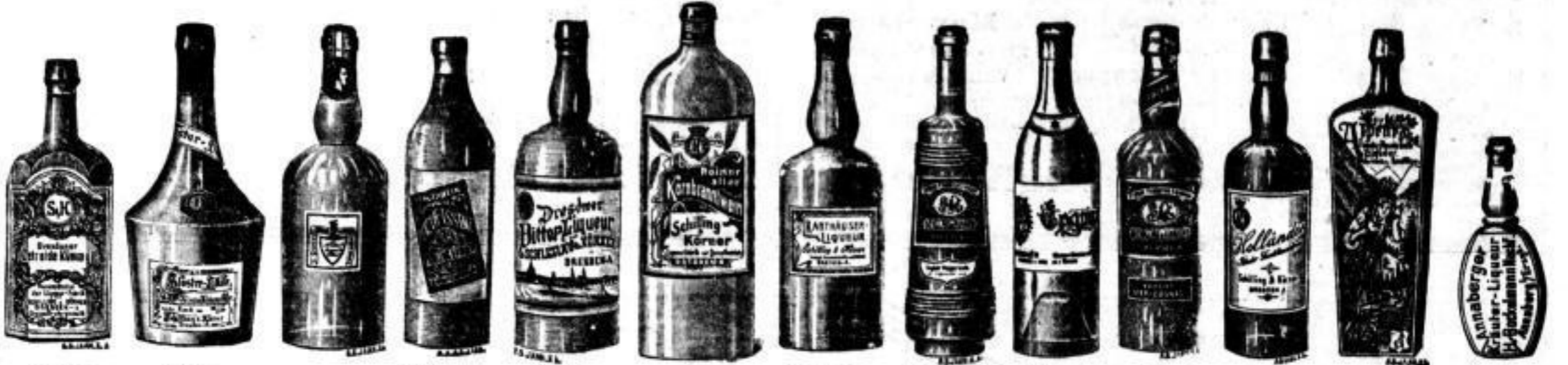
Dresdner Getreide-Kümmel, Kloster-Likör, Allasch, Schlummer-Punsch-Essenz, Dresdner Bitterlikör, Alter Korn, Karthäuser-Likör, Ingber, gelb (Magenwein), Cognac Dujardin, Cognac-Ei-Crème, Holländer, Alpenrose, Annaberger Kräuter-Likör.

Destillation aus besten Rohprodukten! Vorzüglliche Spezialitäten!