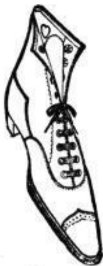
„Nora“ mit Korkboden

Unentbehrlich bei der gegenwärtigen Witterung.