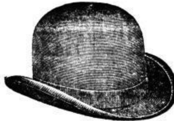
Der leichte Hut