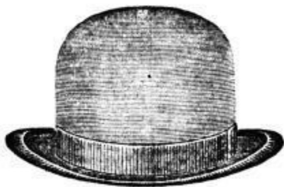
Der neue Hut

Trifflure! Damen-Wäsche mit Besatz billig zu verkaufen Siegelstr. 31, part.