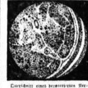
Querschnitt eines verbrauchten Nervenfasers; ein großer Teil der Nervenzellen ist vollständig zugrunde gegangen durch die geringe Menge des Stoffwechsels (siehe Eccithin).

Nerven ein Stoffwechsel an Nervensubstanz statt, und zwar so, daß in dem ermüdeten, schwachen oder kranken Nerv die Nervensubstanz schwindet, wie man es am Querschnitt der Nerven unter dem Mikroskop deutlich beobachten kann. Führt man einem in geschwächtem Körper neue Nervensubstanz zu, so wird, wie zuerst die Forscher Desjardes und Salu in den amtlichen Berichten der französischen Akademie der Wissenschaften erwiesen haben, diese besonders im Gehirn, Rückenmark, überhaupt im ganzen Nerven-system zurückgehalten und für den Lebensprozess sofort verwendet.