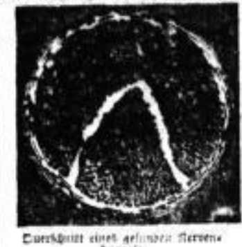
Querschnitt eines gefassten Nervenfasers.

wir unzulässig und mechanisch unsere tägliche Berufsarbeit, die uns keine Pausen gestattet. Unter Körper wird vernachlässigt; Sport und Spiel ungenügend gepflegt, werden zur unfruchtbaren Anstrengung, statt durch Erfolg und Sieg unsern Geist zu er-möglichen, zu erbeben. Nach-dem überreizt, finden wir keinen Appetit, unser Gehirn vermischt uns nicht mehr Behaglichkeit, Ruhe und Erholung. Unlust, Un-gleichgewicht, Unruhe, Sorgen tau-nen uns den Schlaf, treiben uns un-ter umher und lassen uns not-gedungen zu bedrückenden Mitteln greifen, um unsere Nerven künst-lich für kurze Zeit aufzuheitern oder zu betäuben. Gegen dieses Übel, welches nur in unseren verbrauchten Nerven liegt und aus ihnen stammt, finden wir in unseren Medikamenten keine dau-ernde Hilfe, und eine Methode