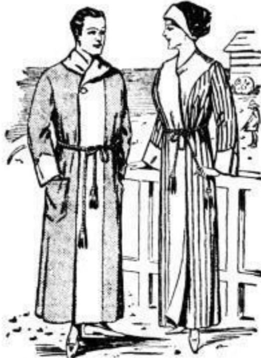
Herren-Bademantel, uni Frottiertoff, mit uni Besatz in allen Farben, rot mit grau, gelb mit schwarz usw., 150 cm lang 14,50. Damen-Bademantel, Geißhaform, neueste Dessins mit weißem Besatz . . . . . 15,-.