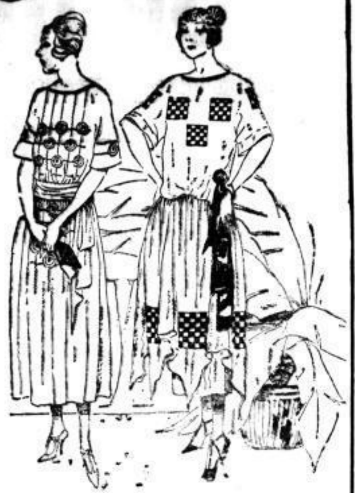
Modernes Crêpe-de-Chine-Kleid mit neuartiger Seiden-Stickerei in dunklen Modelfarben u. zarten Blaufarben vorrätig, 925 Elegantes Crêpe-de-Chine-Kleid neuart. Verarbeitung in modernen Farben mit schwarzer Lackbandgarnitur und Lackbandbesatz