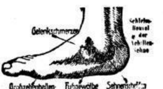
Sen. Fuß u. seine Leidensgeschichte

Die Firma August Kützer ist während ihres 62jährigen Bestehens stets bemüht gewesen, dem Publikum die neuesten Errungenschaften der orthopädischen Wissenschaft und Technik zukommen zu lassen.