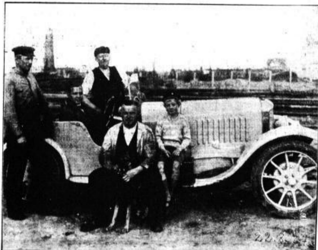
Der bekannte Flieger von Ebnat Kapitan Günther Plüschow, den unser Bild am Eiseren seinen Wagens im Dörsamer Hofen zeigt, begleitet von seiner Gattin, auf einem kleinen Segelschoner mit nur sieben Mann Besatzung eine Forschungsreise nach dem Feuerlande zu unternehmen.