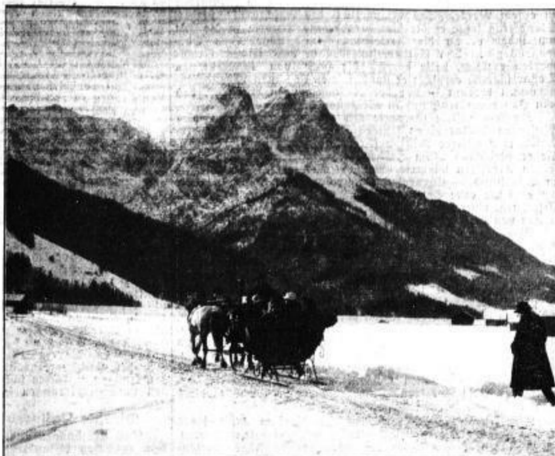
Winter in Garmisch-Partenkirchen. Die Alpspizze im Schnee.