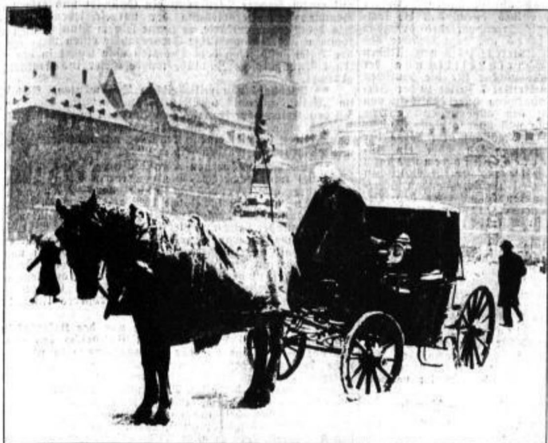
Das eingeschneite Dresden.