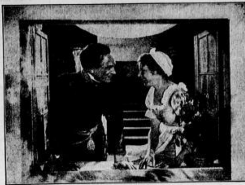
Conrad Veidt und Mady Christians