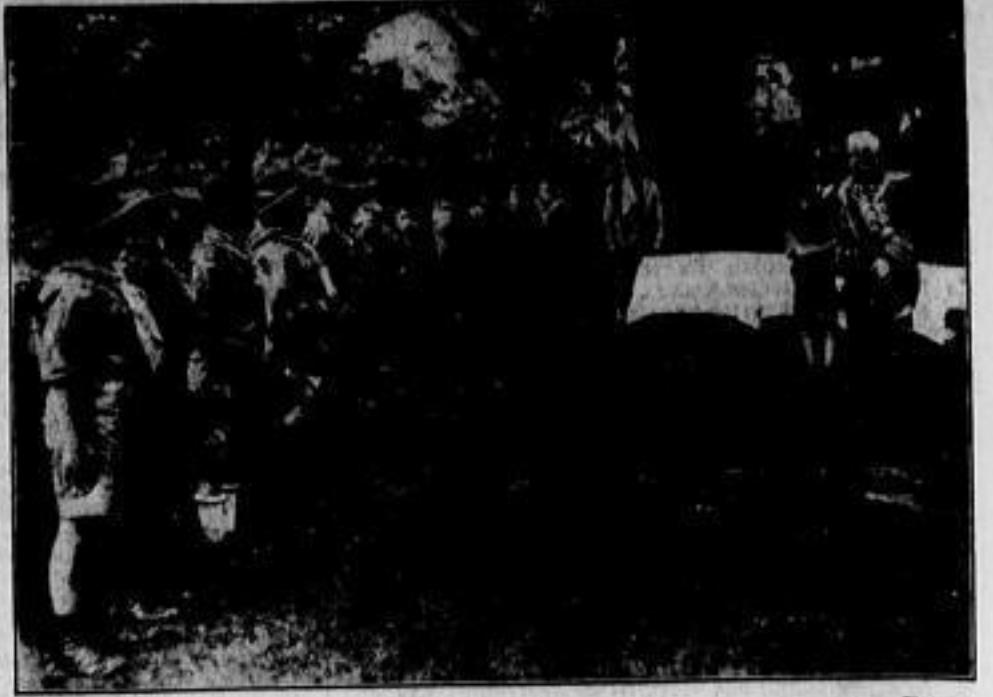
Japanische Boy Scouts der Stadt Tokio beim Ministerpräsidenten Saito

Am Sonnabendnachmittag wurde die Weihnachtsmärchenstadt, eine Wohltätigkeitsveranstaltung für die Berliner Winterhilfe, in der Kaiserdammhalle eröffnet. Die Künstler hatten diese in den weihnachtlich geschmückten Marktplan einer alten schönen Stadt verwandelt