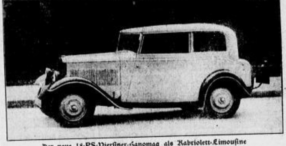
Der neue 18-PS-Viergänger-Hanomag als Kabriolett-Limousine