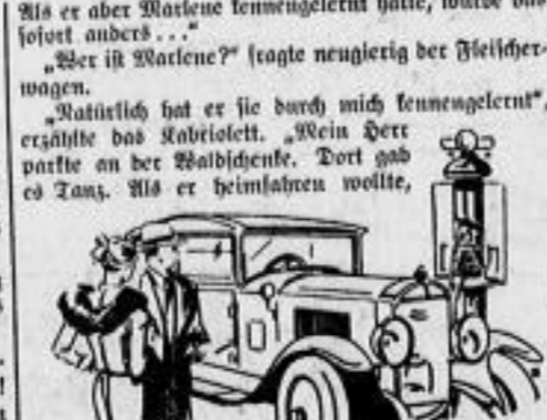
„Ob, was haben Sie für einen schönen Wagen!“, lobte sie ihn...

Durch Streichen die Teplitzer Straße hinaus nach Lockwitz. Rechts nach Lockwitz, das Lockwitztal aufwärts nach Rehefeld. Links an der Kirche vorbei das Tal weiter bis zur Teufelsmühle. Kurz hinter der Teufelsmühle rechts nach Hirschbach und weiter nach Rehefeld. Rechts nach Dippoldiswalde. Das Müglitztal aufwärts bis Schmiebsberg. Bei der Kirche rechts ab durch Niederöbels nach Rehefeld. Das Jagdschloß links lassend nach Rehefeld. Rechts nach Dippoldiswalde. Durch das Müglitztal (Vorflut) viele Kurven, viele ungefährtge Bahnhofswege nach Seibena und weiter nach Dresden.