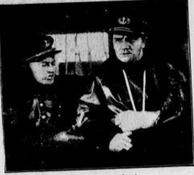
Harry Piel (rechts)