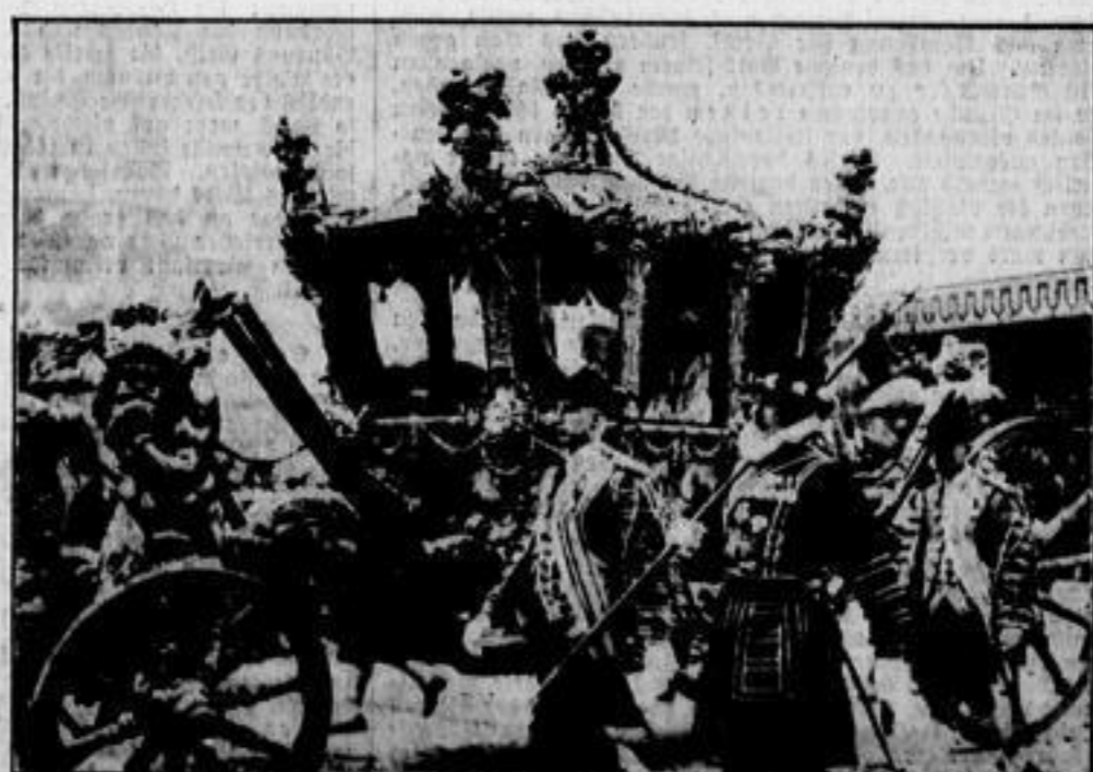
Das Königspaar in der goldenen Staatskutsche auf der Fahrt zur Westminster-Abtei