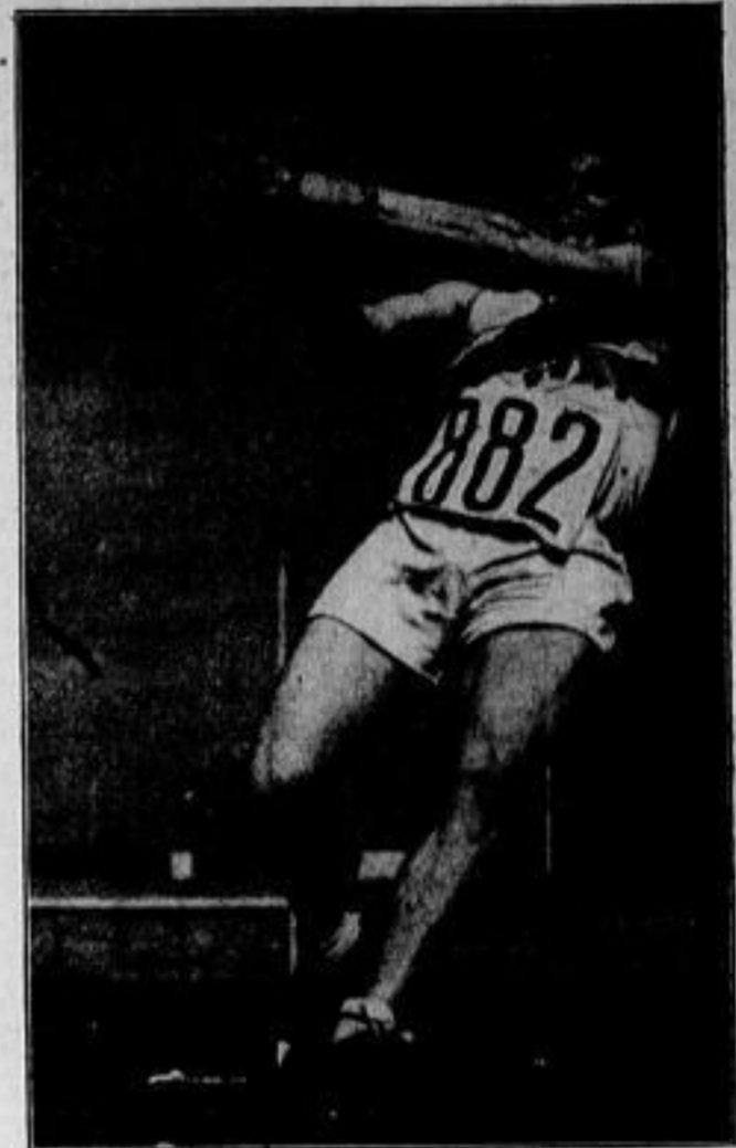
Das Antlitz des Kämpfers

Denn mit diesem Olympia-Film soll ja keine ins Großartige abgewandelte Wochenschau-Reportage der Berliner Festtage von 1936 gegeben werden; sondern Veni Niefenstahl wollte, wie sie selbst sagte, schaffen: das zeitlose Dokument einer großen Idee, einen Hymnus auf die Schönheit und den Kampf. Darum ist dem olympischen Geschehen, vom Fackellauf durch Griechenlands feine Landschaften bis zur Schlußfeier auf dem Reichsportfeld, noch ein Prolog vorangestellt, der den olympischen Gedanken, den Dreiflang der Schönheit vom Körper, Seele und Geist, in bildhafter Schau bann; darum mußte ein neuer Sprechstil für den Begeitertext gesucht werden, der dem Zuschauer die sportlichen Vorgänge nahebringt und sich trotzdem künstlerisch in die Gesamtleistung des Films einfügt; darum mußte die Filmmusik neue Wege einschlagen, die die Komposition als zwangsläufige Ergänzung der Bewegung auf dem Filmbild erscheinen lassen. Und darum ist es schließlich kein Fehler, sondern eine wesentliche, notwendig bedingte Eigenschaft des Olympiafilms, daß er erst jetzt vor die Welt tritt. In der Vergangenheit zeitlich enger Termine hätte die fanatische Hefeschnelligkeit von der Aufgabe nicht ihre volle Erfüllung finden können. Jetzt, mit dem Abstand von dem Geschehen, das der Olympiafilms widerspiegelt, kann er erst das zeitlose Kunstwerk sein, das seine Schöpfer aus ihm gestalten wollten. W. S.