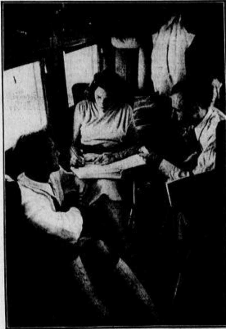
Regieführung im Flugzeug

Aus ihren verbedeten Gruben konnten die Männer vom Olympia-Film dieses Antlitz sehen, das Gesicht des deutschen Hammerwerfers Gein in dem Augenblick, wo er den letzten Schwung zum siegreichen Wurf holt