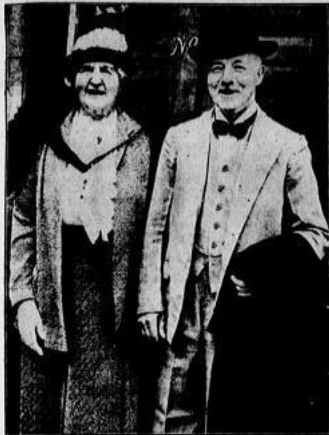
Der Lord und seine Gattin

Das britische Konsulat in Innsbruck ist mit Wirkung vom 31. Juli aufgelöst worden. Die Amtsgeschäfte wurden vom britischen Konsulat in Wien übernommen.