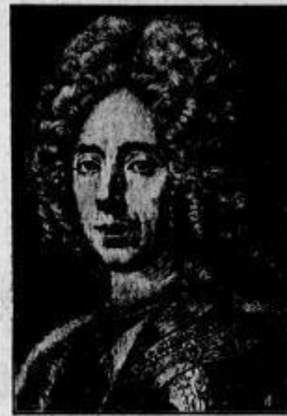
Franz Eugen, Prinz von Savoyen

Glückhafte Fahrt, neuer deutscher Kreuzer! Doppelt glückhafte Fahrt unter diesem stolzen Namen! Das der Reichsstatthalter von Ostpreußen die Taufrede hielt und im Beisein Gorthys die Gattin des Reichsverweyers Ungarns die herkömmliche Flasche am Bug des nunmehr seinem Element übergebenen neuen Witzschers deutscher Seegeltung zerbrechen ließ, wird eine bleibende schöne Erinnerung sein. In gebührenden Worten hat Dr. Seyh-Inquart die symbolische Bedeutung der Wahl dieses Namens umrissen. Auf die Gemeinsamkeiten der europäischen Riten deutete er hin, auf die untrennbare Schicksalsgemeinschaft dieses Raumes. Von den überlebten Führungsanführern älterer Seantagsbilder sprach er, und von der Abwehr bedrohender Angriffe des Ostens. Die kurzen Sätze waren gleichsam Kapitelfüberschriften zu großen Abschnitten gegenwärtiger Politik. Zum ersten Male trägt ein deutsches Kriegsschiff eine Bezeichnung, in der augenfällig die