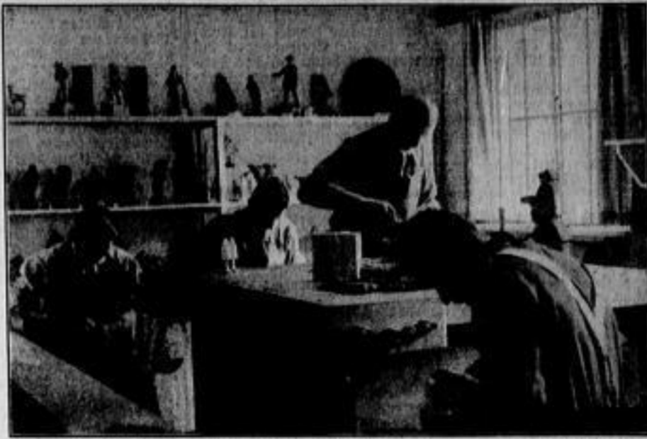
Großstadtjugend schnürt auch