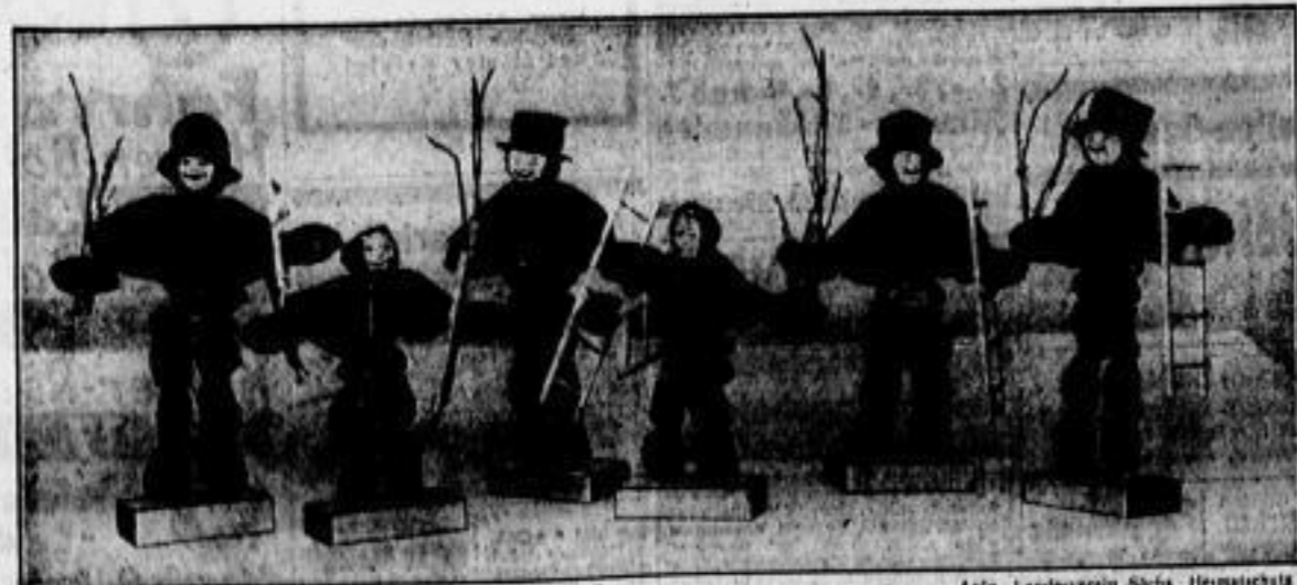
Große, kleine, alle Sorten . . . Pflaumentoffel dürfen auf dem Weihnachtstisch des Ervedners nicht fehlen