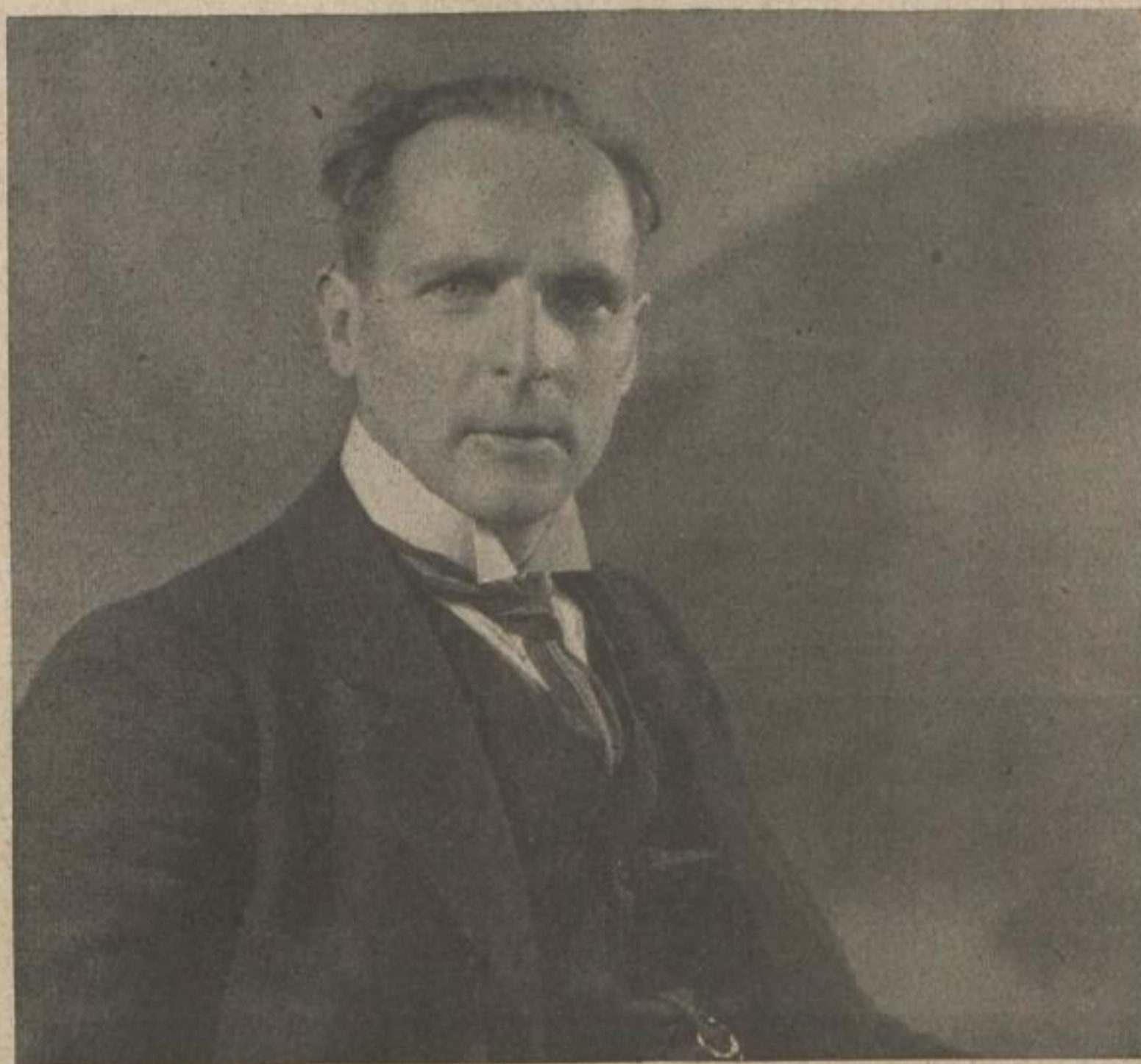
Generalmusikdirektor EDUARD MÖRIKE

DRESDEN - A. / Scheffelstraße 16 / Fernsprecher 11908