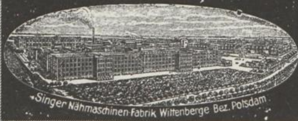
Singer Nähmaschinen-Fabrik, Wittenberge, Bez. Potsdam

ERLEICHTERTE ZAHLUNGSBEDINGUNGEN SINGER LÄDEN ÜBERALL SINGER CO. NÄHMASCHINEN ACT. GES.