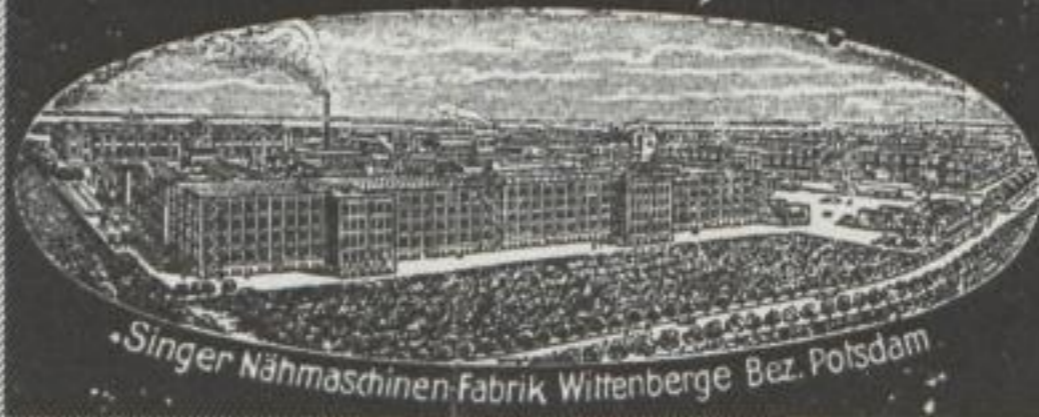
Singer Nähmaschinen-Fabrik Wittenberge Bez. Potsdam

ERLEICHTERTE ZAHLUNGSBEDINGUNGEN SINGER LÄDEN ÜBERALL SINGER CO. NÄHMASCHINEN ACT. GES.