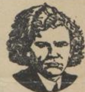
WILH. BACKHAUS spielt wie andere Künst- ler auch