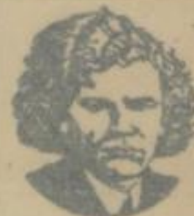
WILH. BACKHAUS spielt wie andere Künst- ler auch