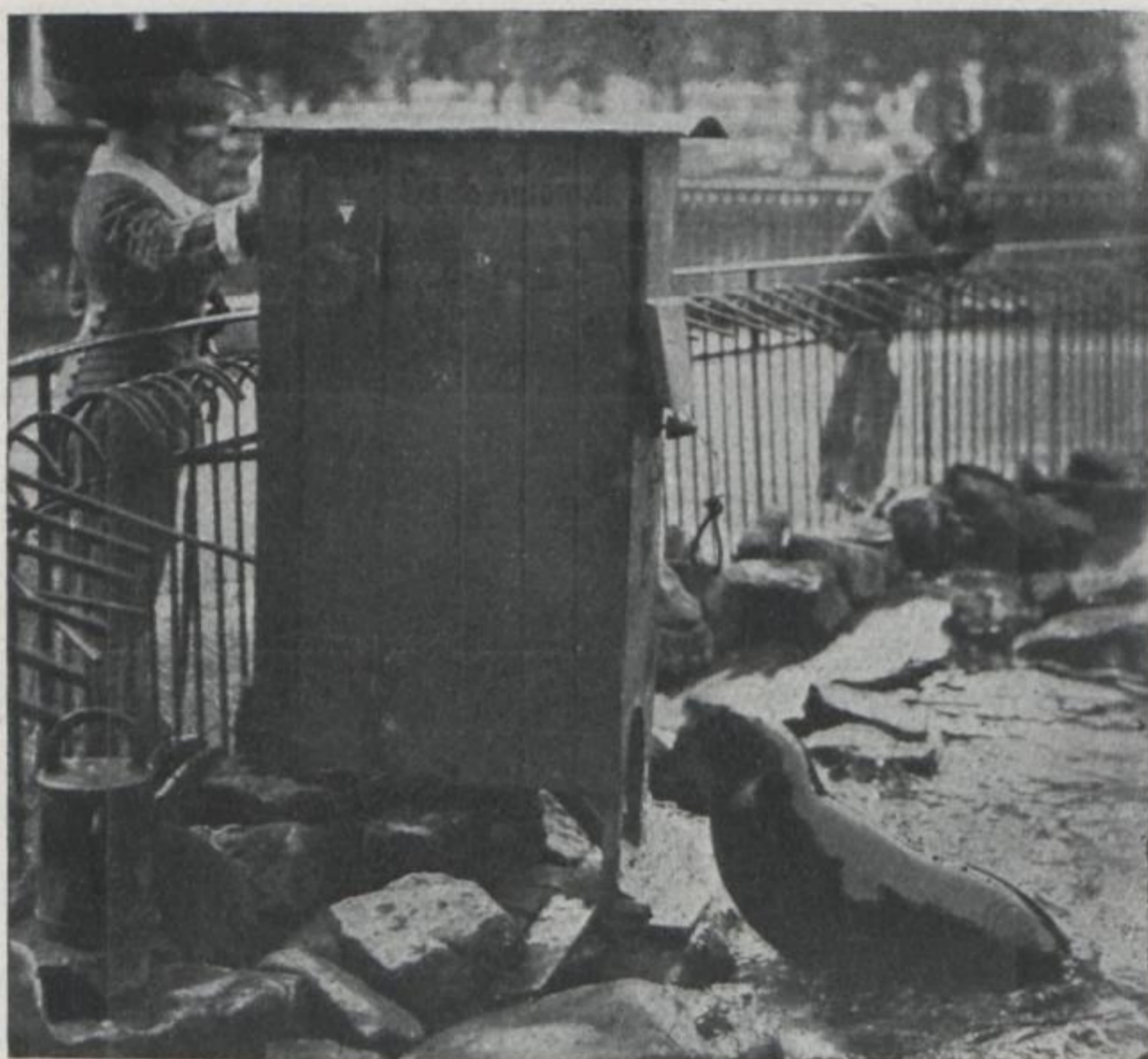
Seelöwe am Fischautomaten

die Fütterungszeiten angeschlagen. Ist diese Zeit noch fern, so hält man sich hier nicht auf, sondern richtet sich so ein, daß man rechtzeitig zur Fütterung wieder zur Stelle ist. Ist die Fütterung aber nahe bevorstehend, so bleibt man an Ort und Stelle oder doch in der Nähe. Der aufgestellte Kasten-Automat gewährt