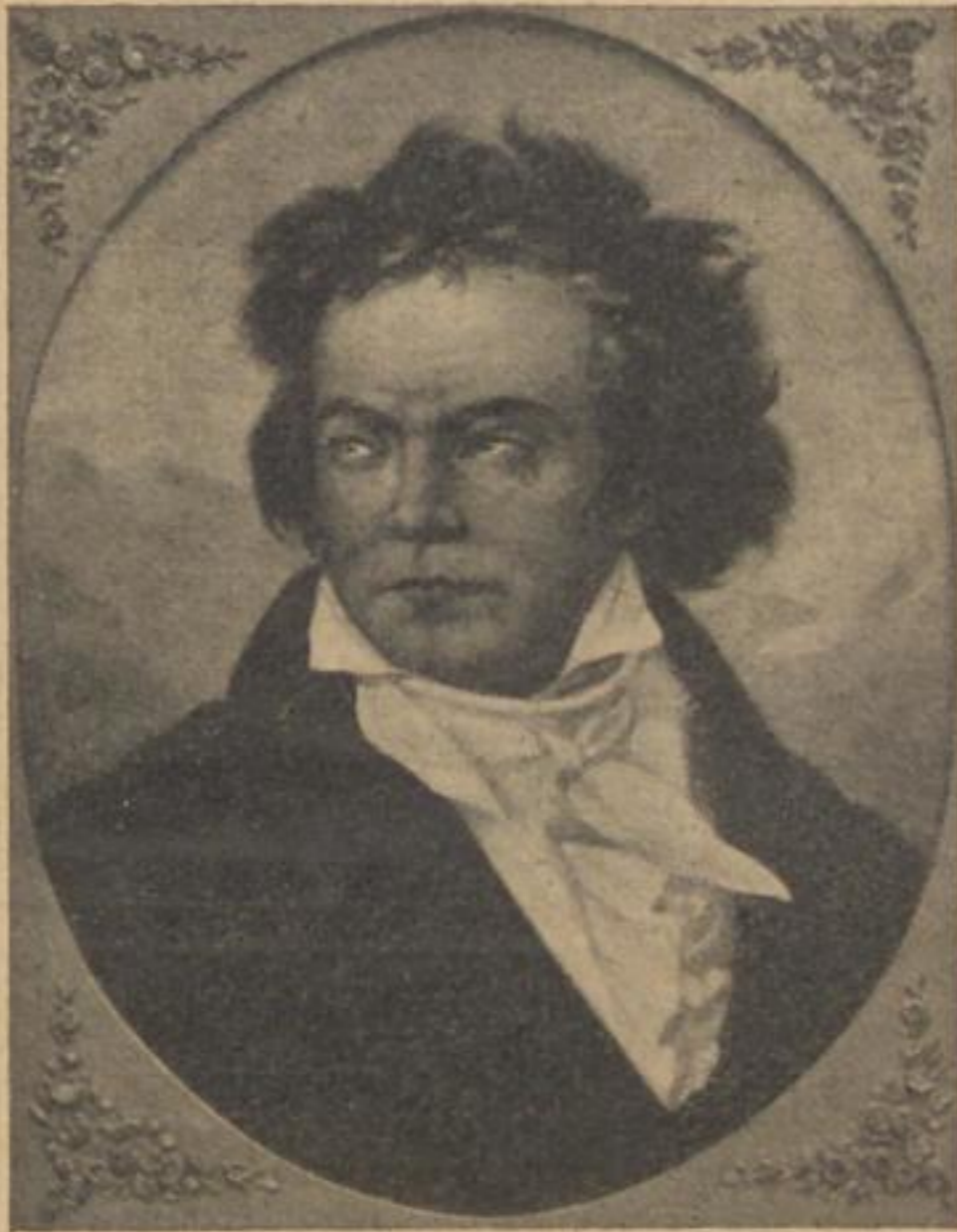
Ludwig von Beethoven