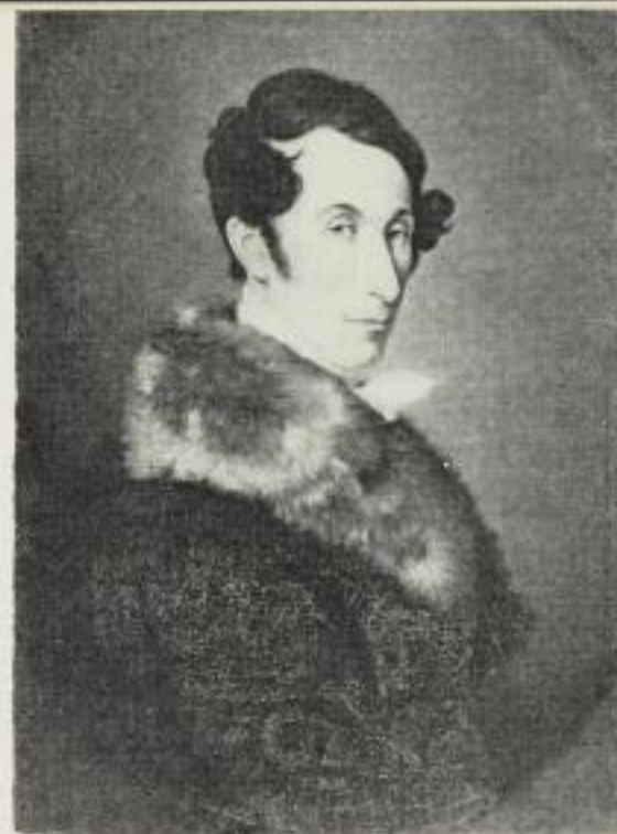
CARL MARIA VON WEBER

Die romantische Feenoper „Oberon“, für London komponiert und dort 1826 uraufgeführt, war Webers letztes musikdramatisches Meisterstück, der Schwanengesang des bereits Todkranken. Das nach Wielands „Oberon“-Epos verfaßte Libretto des Engländers James Robinson Planché schildert den Streit zwischen dem Elfenkönig Oberon und seiner Gemahlin Titania darüber, wer bei den