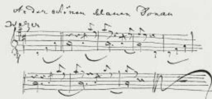
Anfangstakte des Walzers in der Notenschrift des Komponisten