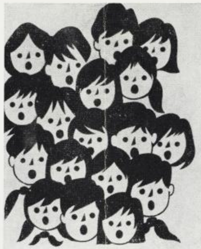
Titelblatt des Buches „Mein Schulchor“ (Mladen Statev)