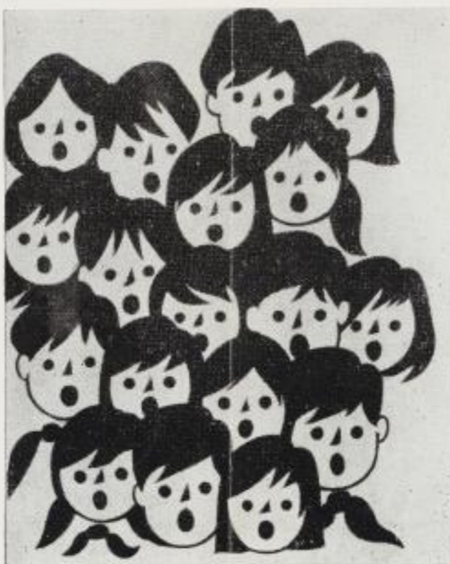
[Titelbild des Buches „Mein Schulchor“ (Mladen Statev)]