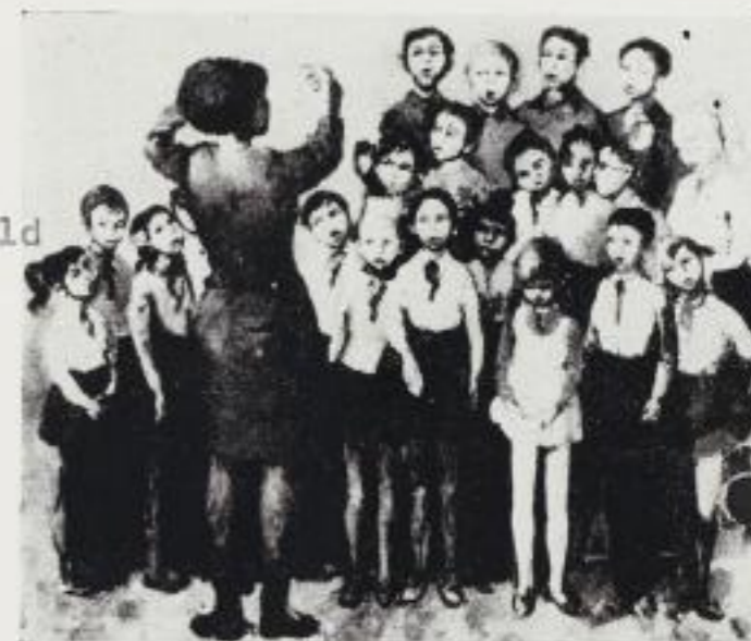
„Das Konzert“ Olgemälde der Dresdner Malerin Friderun Bondzin, gekauft vom Staatsrat der DDR als Geschenk für das Kindertheater Moskau

Mehrstimmiges Musizieren ist viel reizvoller als einstimmiges; freilich erfordert es mehr Übung.