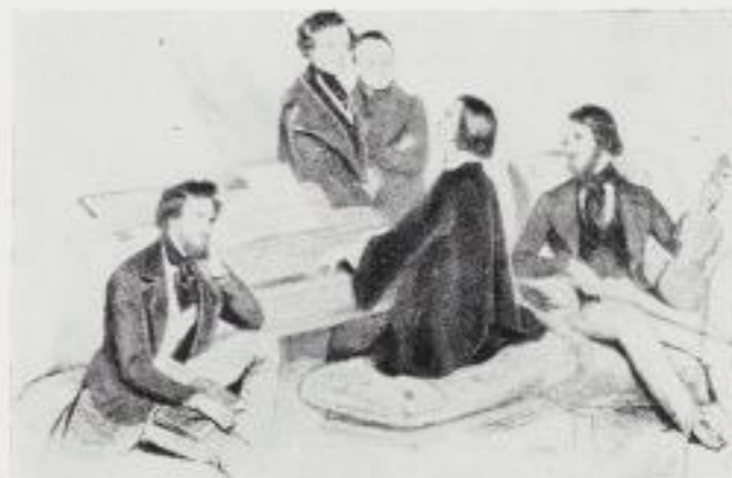
Franz Liszt spielt. Unter den Zuhörern Berlioz und Czerny

Der 1. Satz beginnt sogleich mit dem vom Orchester vortragenen energischen, heroischen Hauptthema, dem Liszt übrigens die Worte „Das versteht ihr alle nicht!“ unerlegt haben soll. Die vielgestaltige Verarbeitung des Hauptthemas, das sich bis zum Schluß behauptet, dominiert im Verlauf des gesamten – große dynamische Steigerungen und scharfe Kontraste aufweisenden – Satzes, aber auch ein gefühlvoll-melodiöses Seitenthema des Soloinstrumentes wird wirksam. Orchester- wie Klavierpart sind mit größter Virtuosität behandelt. Schwelgerisch-schwärmerische Lyrik charakterisiert den langsamen Satz in H-Dur (Quasi Adagio), auf den ohne eigentlichen Abschluß unmittelbar ein Allegretto vivace mit kapriziösem Klavierthema folgt, dessen neuartige Schlagzeugeffekte den gefürchteten Wiener Kritiker Hanslick veranlaßten, das Werk boshafterweise als „Triangelkonzert“ zu bezeichnen. Pausenlos wieder ist der Übergang ins Finale, das gleichsam als eine zündende Marschfantasie angelegt ist und noch einmal die Hauptgedanken der vorangegangenen Sätze aufgreift. Glanzvoll-strahlend schließt dieser Satz, in dem der Solist nochmals reiche Gelegenheit hat, seine Virtuosität zu entfalten, das Konzert ab.