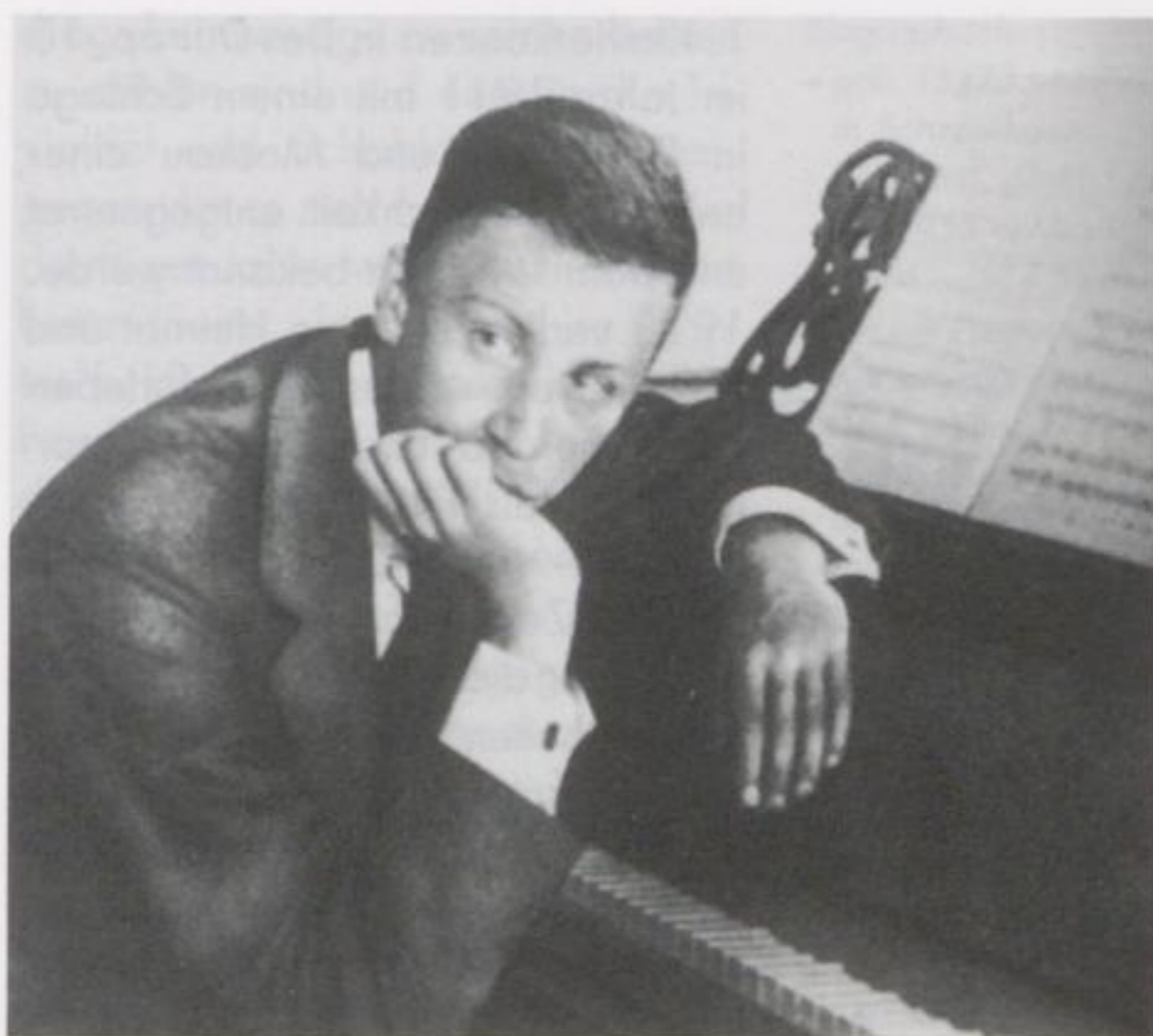
Sergej Prokofjew; Foto von 1910

Das Werk von Sergej Prokofjew umfaßt nahezu alle musikalischen Genres von der Kammermusik bis zur Sinfonik und der Oper. Prokofjew ist wohl der populärste russisch-sowjetische Komponist im 20. Jahrhundert, und nur Dmitri Schostakowitsch ist ehrlichen Herzens in einem Atem mit ihm zu nennen. Prokofjews Tonsprache ist von optimistischer Kraft und Lebensfreude geprägt, fernab von banaler Volkstümelei und Trivialität. Und doch ist er modern im besten Sinne. Allerdings ließ er sich auf Dauer nicht von den allzu radikalen, modernistischen Avantgardisten anstecken, obwohl er – vor allem in frühen Jahren – mancherlei erprobt hat, was ihm immer wieder hart angekreidet wurde und ihm Gegner auf den Plan rief, aus dem sich in seiner Heimat immer wieder heftiger Parteienstreit entwickelte. Seine Kompositionen blieben zeitlebens harmonisch ausgesprochen kühn-dissonant, obwohl sie sich durchaus im tonalen Rahmen bewegen und dadurch einer älteren Tradition verhaftet scheinen. Sie sind oftmals von einer lyrisch-kanta-